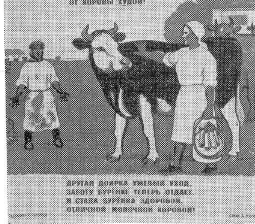
ДРУГАЯ ДОЯРКА УМЕЛЫЙ УХОД. ЗАБОТУ БУРЕНКЕ ТЕПЕРЬ ОТДАЕТ. И СТАЛА БУРЕНКА ЗДОРОВОЙ, ОТЛИЧНОЙ МОЛОЧНОЙ КОРОВОЙ!

Когда к нерадивой доярке попала, Буренка давать молоко перестала... Какой там надой от коровы худой! Другая доярка умелый уход, Заботу Буренке теперь отдает. И стала Буренка здоровой, Отличной молочной коровой!