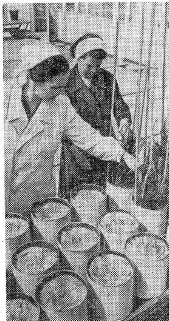
(один из таких недостатков — высокая гигроскопичность). В агрохимическом отделе сейчас ведутся работы по исследованию более перспективных форм таких удобрений — обогащенного калинита, плавящего магниевого фосфата. Эти удобрения будут весьма полезными для легких почв таких областей, как

Повседневная, а не эпизодическая борьба за выполнение директив партии и собственных решений — обязанность каждой первичной партийной организации, их бюро и секретарей. Партийные вожаки должны показывать пример, как практически организовать дело. Именно в этом должна проявляться их роль как организаторов масс.