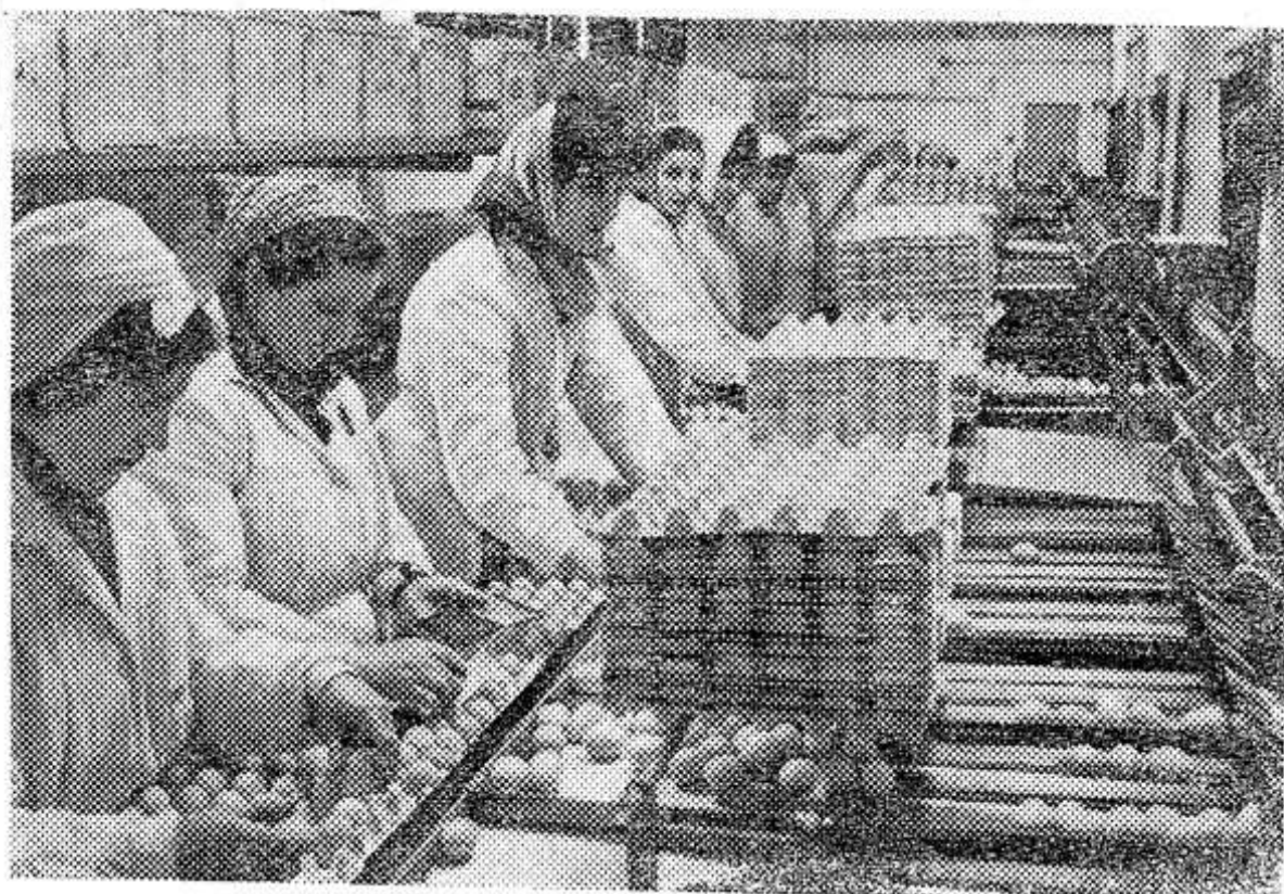
Народная Болгария изготавляет высокопроизводительные машины для механической сортировки яиц. Современное оборудование экспортируется в братские социалистические страны.

К-3 «Прогресс», Тамбовский район, Амурская область.