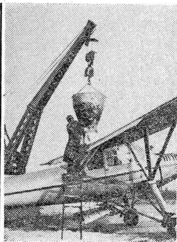
В сельском хозяйстве Чехословацкой Социалистической Республики широко применяется авиация. Ее основное назначение — удобрение и опыление полей. Очень удобен для этой цели чехословацкий самолет «Бригадир». Он может делать ежедневно 80 вылетов, обрабатывая каждый раз пятьдесят гектаров.

НА СНИМКЕ: загрузка удобрений в самолет.