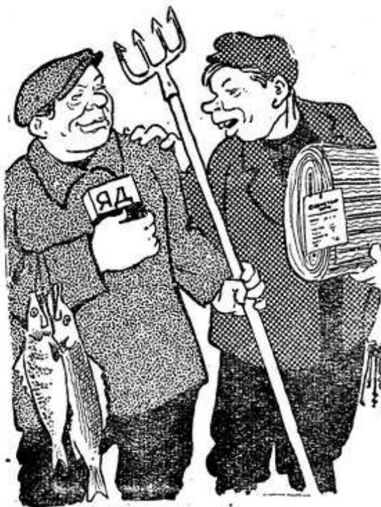
Сашка с ружьем, Яшка с острой — браконьеры тот и другой.