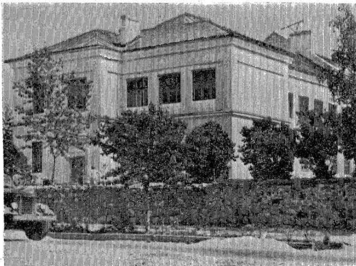
На снимке: на улице Ленинской г. Опочки (здание педучилища).

Опочечское объединение «Сельхозтехника».