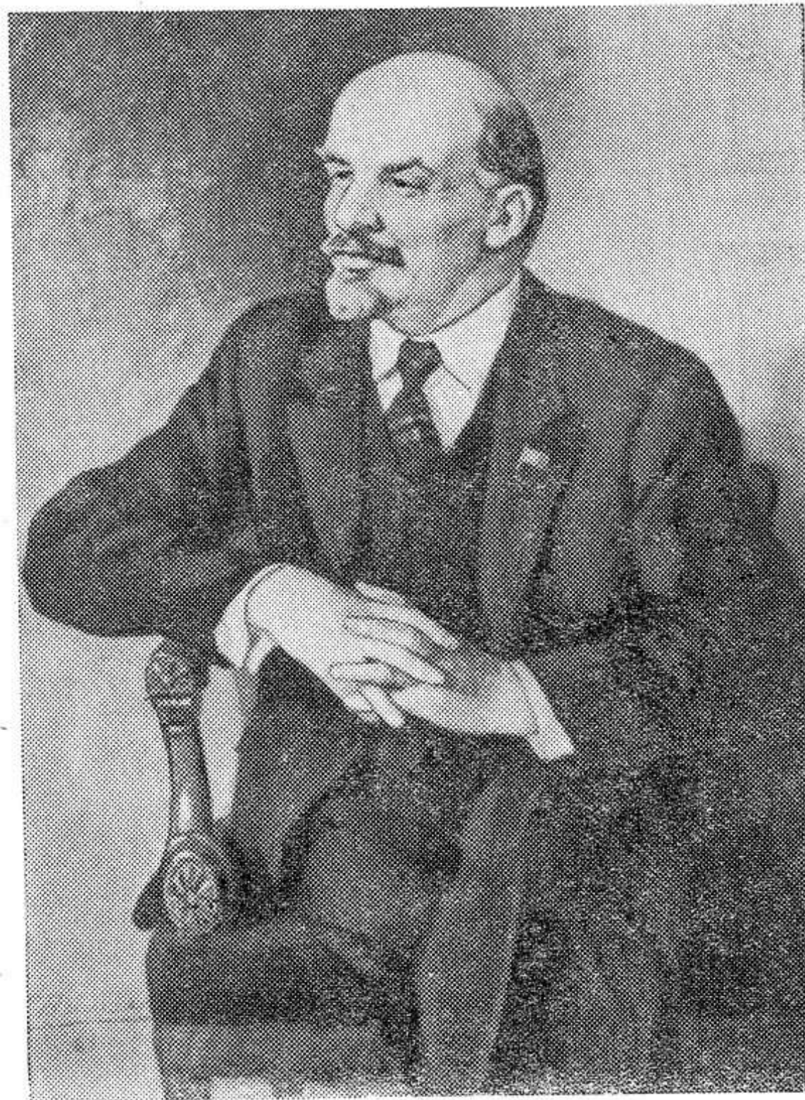
В. И. ЛЕНИН.

Портрет работы заслуженного деятеля искусств РСФСР П. В. Васильева.