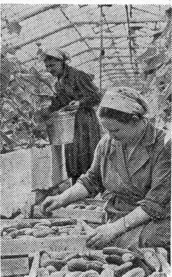
Тысячи центнеров овощей ежегодно поставляет трудящимся Ленинграда совхоз «Тепличный». Сейчас здесь созрели огурцы, их будет сдано 7.230 центнеров, значительно больше, чем в минувшем году.