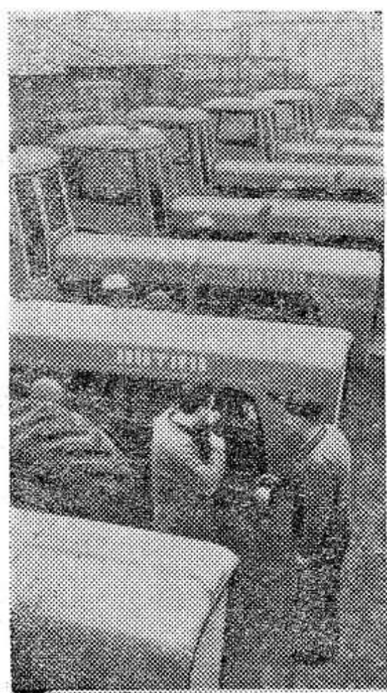
Будапештский тракторный завод «Вереш чиллаг» налаживает серийное производство новой машины с шестичилиндровым двигателем мощностью 90 лошадиных сил. Технические испытания подтвердили надежность и экономичность конструкции. Предприятие занимается выпуском тракторов этого типа по рекомендации Совета экономической взаимопомощи.

Венгрия — это выход к «альпийской крепости» Германии. Вот почему гитлеровский генеральный штаб бросал сюда массу войск и техники.