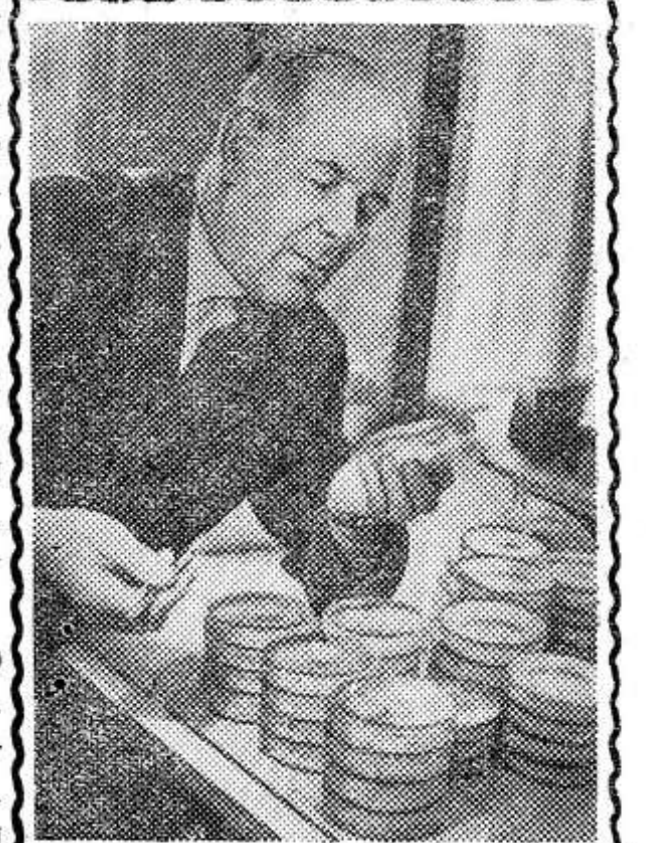
ЯРОСЛАВСКАЯ ОБЛАСТЬ. Интенсивно ведет сельскохозяйственное производство коллектив колхоза «Новая Кештома» Пощехонского района. Забота о земле, о повышении ее плодородия, хорошо организованная агрономическая служба — вот источники получения больших доходов от каждого гектара земли.

Особенно значительных успехов добились колхозные льноводы. В минувшем году с каждого из 419 гектаров было собрано по 6 центнеров льноволокна и 5,17 центнера льносемян. Каждый гектар, занятый льном, дал хозяйству 1.272 рубля дохода.