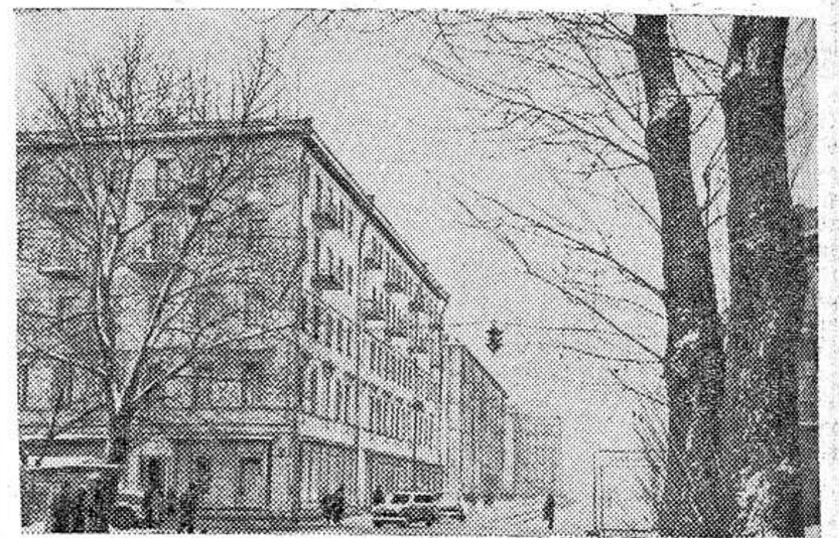
Ленинградцы свято чтят память воинов Советской Армии, беззаветно сражавшихся, защищая город Ленина от фашистских захватчиков. Многие улицы и проспекты ныне носят имена героев боев и полководцев.

Генерал-майор авиации, дважды Герой Советского Союза.