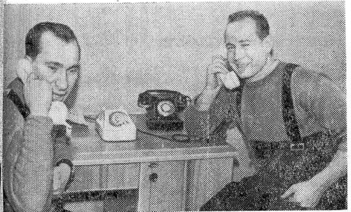
Космонавты Павел Иванович Беляев и Алексей Архипович Леонов после приземления.

Командир корабля «Восход-2» полковник П. И. Беляев рапортовал Центральному Комитету КПСС, Президиуму Верховного Совета СССР, Совету Министров СССР об успешном выполнении поставленной перед экипажем задачи. (ТАСС).