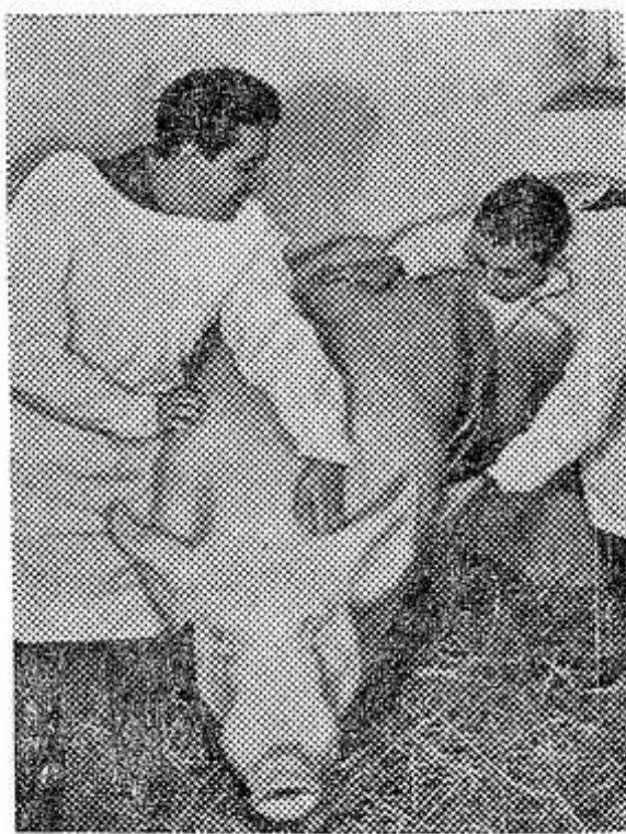
Ежегодно сельскохозяйственные школы и техникумы Польской Народной Республики выпускают около пяти тысяч квалифицированных животноводов, агрономов, мелиораторов, механизаторов.