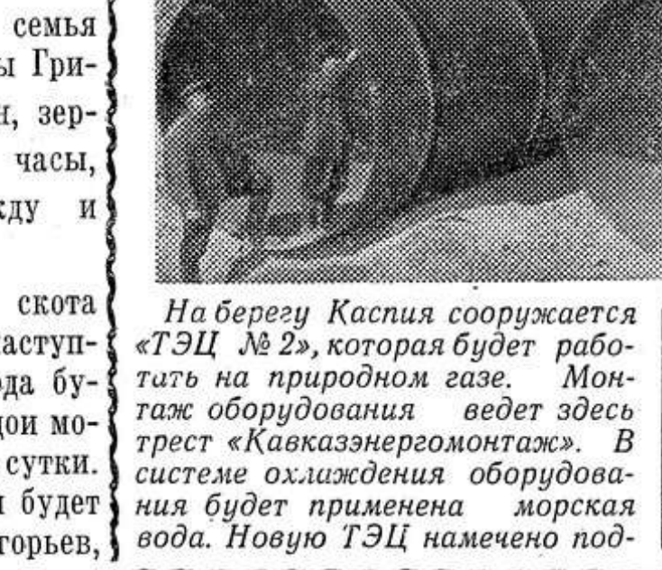
На берегу Каспия сооружается ТЭЦ № 2, которая будет работать на природном газе. Монтаж оборудования ведет здесь трест «Кавказэнергоаппарат». В системе охлаждения оборудования будет применена морская вода. Новую ТЭЦ намечено под-