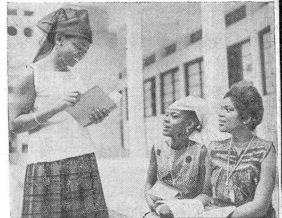
РЕСПУБЛИКА КОНГО (БРАЗЗАВИЛЬ). У африканской молодежи большое стремление к знаниям. Сотни юношей и девушек обучаются в лицее Браззавиля.