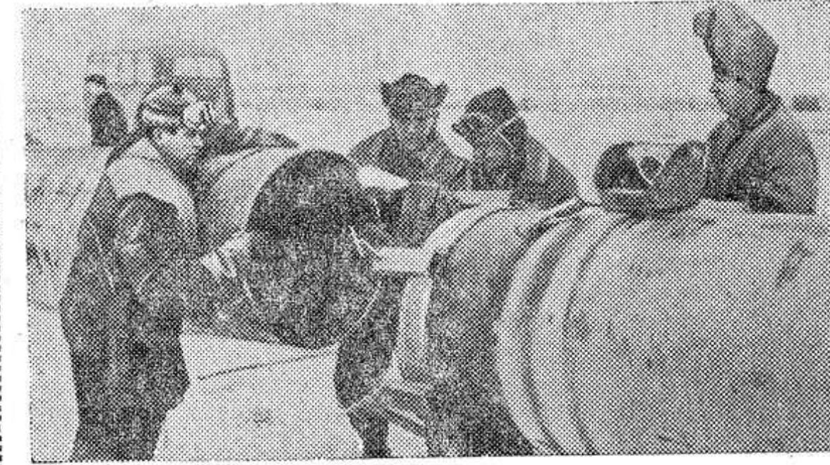
На территории Чехословакии началось строительство газопровода Братислава — Дашава протяженностью 520 километров, по которому в ЧССР будет поступать ежегодно около миллиарда кубометров советского природного газа. Он будет использоваться для газификации городов и районов Словакии, а также как сырье для химической промышленности. НА СНИМКЕ: сварка стальных труб на участке трассы в районе восточнословацкого города Кошице.