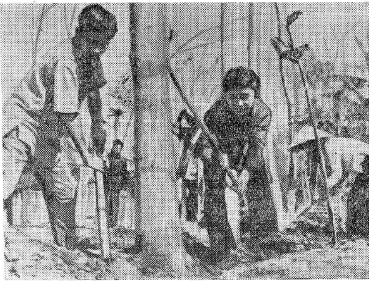
Каждой весной в Демократической Республике Вьетнам проводится посадка деревьев. В прошлом году в провинции Винь Фук было высажено 7.437 гектаров лесов и садов. К весне 1965 года здесь подготовлено свыше 10 миллионов саженцев.