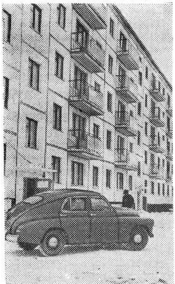
С каждым годом растут и благоустраиваются села Ленинградской области. НА СНИМКЕ: новый жилой дом на центральной усадьбе совхоза «Гатчинский». К весне в него переселится 80 семей совхозных рабочих.

Г. Поваренкин, секретарь парторганизации ремзавода.