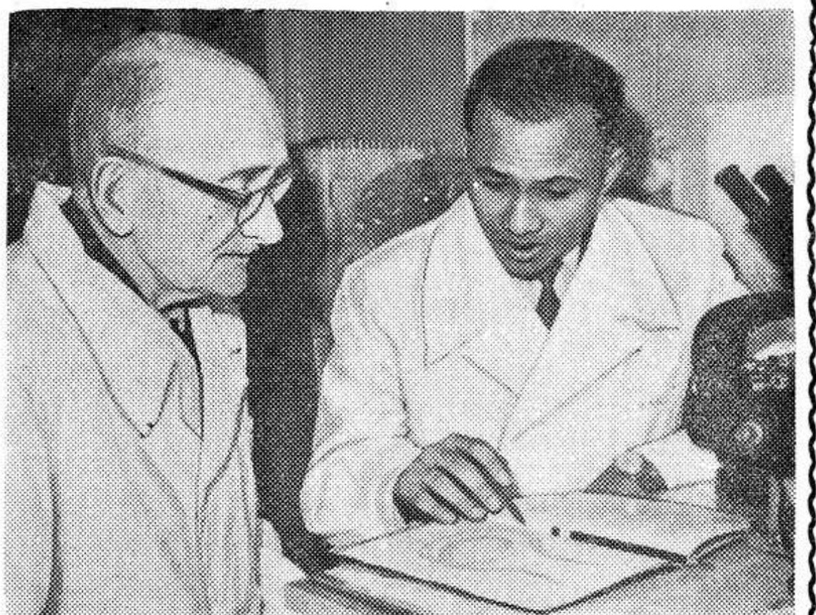
МОСКВА. Фитогельминтологический кабинет гельминтологической лаборатории академика К. И. Скрябина Академии наук СССР занимается изучением паразитических нематод (круглых червей) растений, наносящих большие потери сельскому хозяйству. В задачу кабинета входит изучение видового состава нематод растений, их биологии, экологии, происхождения, а также мер борьбы с ними. Кабинет ведет большую работу по подготовке кадров фитогельмин-