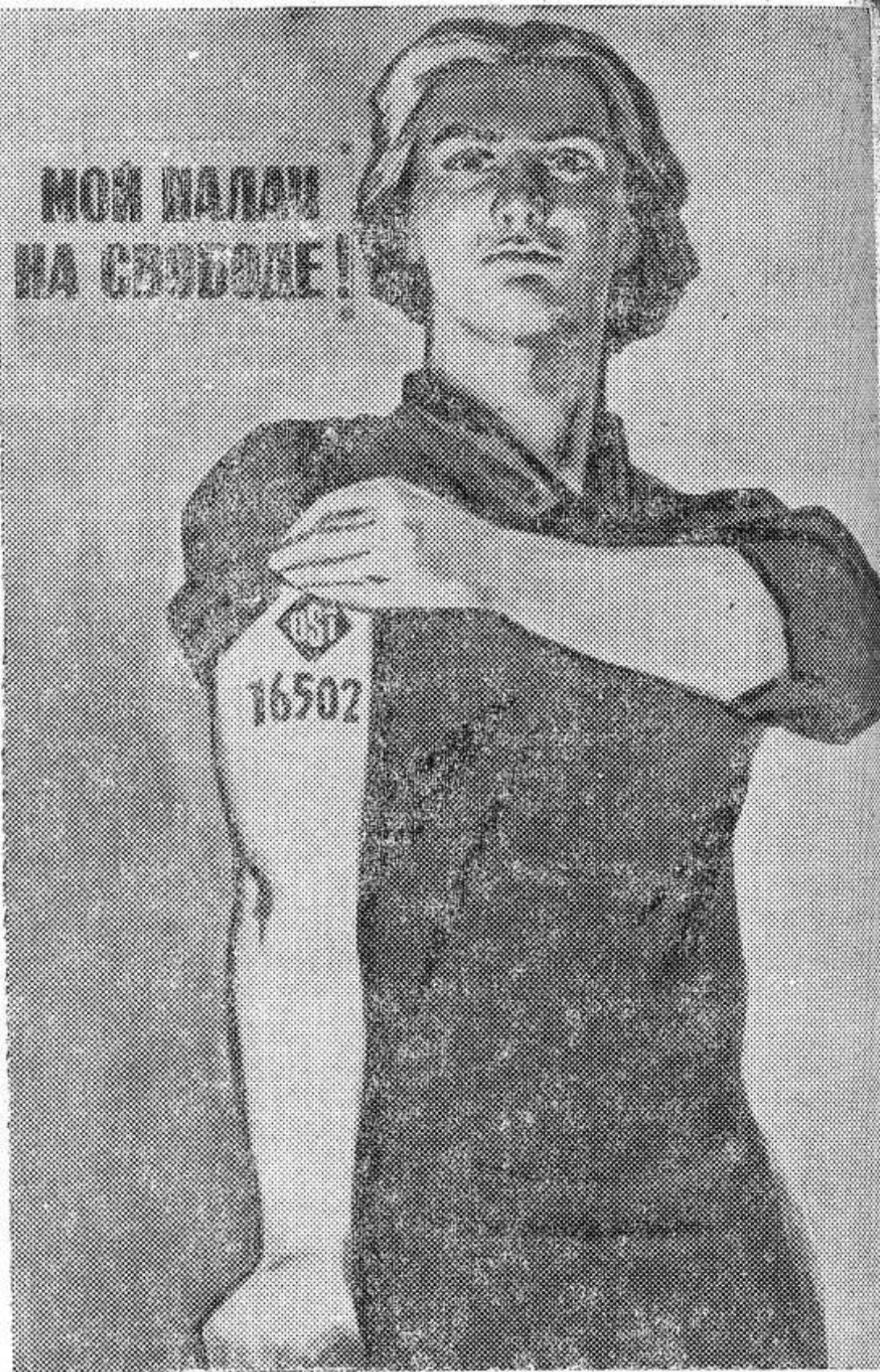
Плакат художников В. Владимиров и Ф. Качелаева (издательство «Советский художник»).