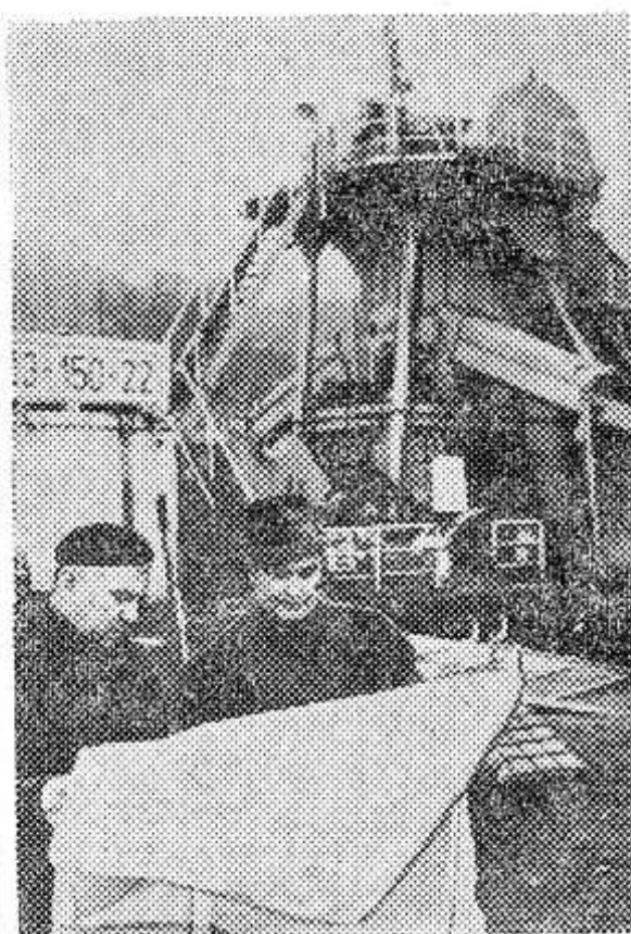
Предприятие «Чешские судостроительские верфи» в Праге по советским заказам изготавливает насосные станции, многоковшовые экскаваторы, земснаряды.