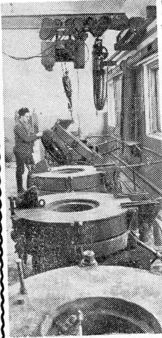
В Вологодском объединении «Сельхозтехника» вступил в строй цех по реставрации шин автомобилей, тракторов и сельхозмашин. Метод гидравлической опрессовки шин, применяемый в цехе, обеспечивает высокое качество ремонта.

Социалистические обязательства обсуждены и приняты на районном совещании работников сельского хозяйства 28 февраля 1965 года.