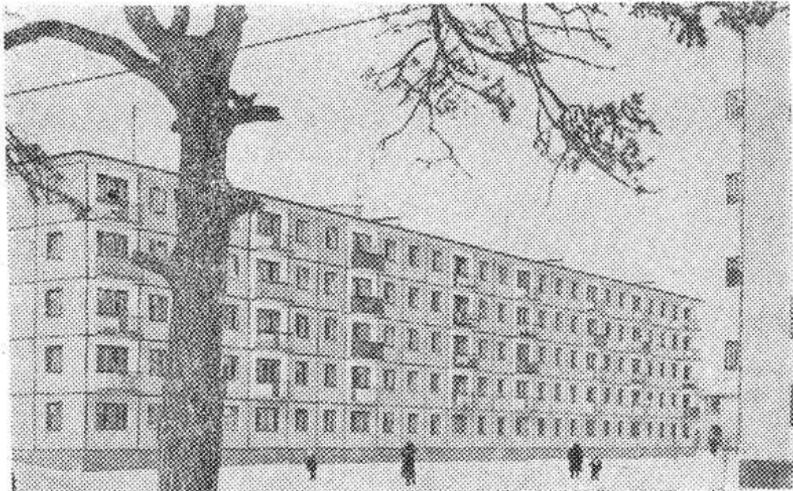
НА СНИМКЕ: два года назад этой улицы еще не было в городе, а сейчас на Восточной улице десять 80-квартирных домов.