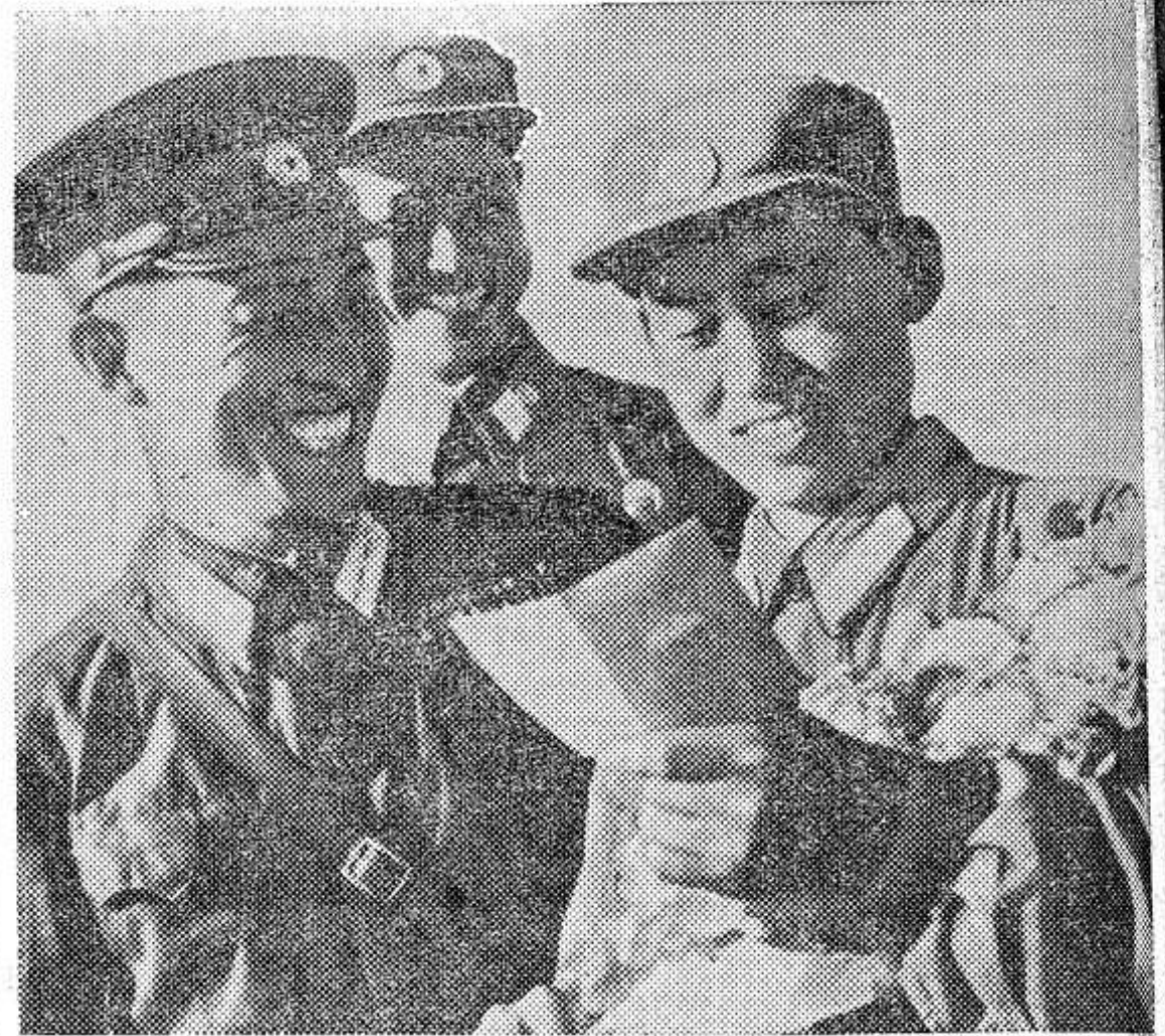
Командиры Корейской Народной Армии поздравляют бойца с присвоением ему почетного звания.