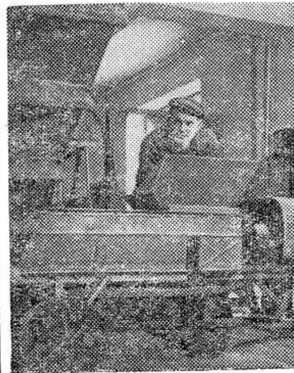
В специальном конструкторском бюро сельскохозяйственных машин Ленсовнархоза работают машины и механизмы для уборки картофеля, овощеводства и гербицидов в почву. Некоторые из них уже введены в колхозах и совхозах Северо-Запада.

Несмотря на эти трудности, годовой план строительных работ нашим коллективом выполнен на 116,2 процента, из 12 плановых объектов введено в эксплуатацию 15. И в этом году работаем с низкой темпов, соревнуемся, чтобы досрочно выполнить семилетку.