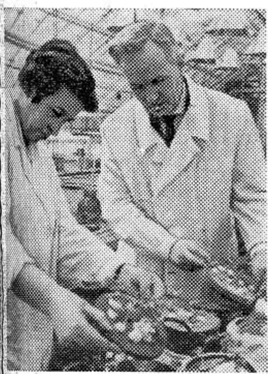
МОСКВА. Фитотрон Института физиологии растений имени К. А. Тимирязева Академии наук СССР. Так называется научное учреждение, где с помощью искусственного климата ведутся сложные экспериментальные работы, направленные на повышение урожайности сельскохозяйственных культур для различных районов страны. Здесь изучается морозостойкость, засухоустойчивость и солеустойчивость растений, проводятся опыты с применением метода культуры изолированных органов и тканей, исследования в области корневого питания растений.