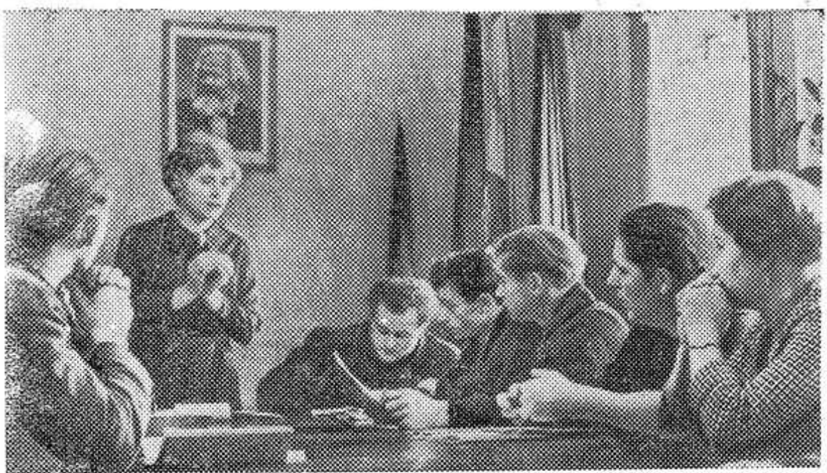
Относительно затихшие зимние месяцы труженики сельского хозяйства Германской Демократической Республики используют для учебы. НА СНИМКЕ: члены сельскохозяйственного производственного кооператива «Фрайе эрде» в