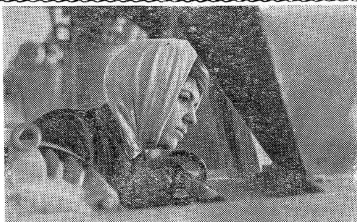
стей Поволжья и Северо-Запада, отправляют на Урал и в Сибирь. Фото Е. Соколова. Фотохроника ТАСС.