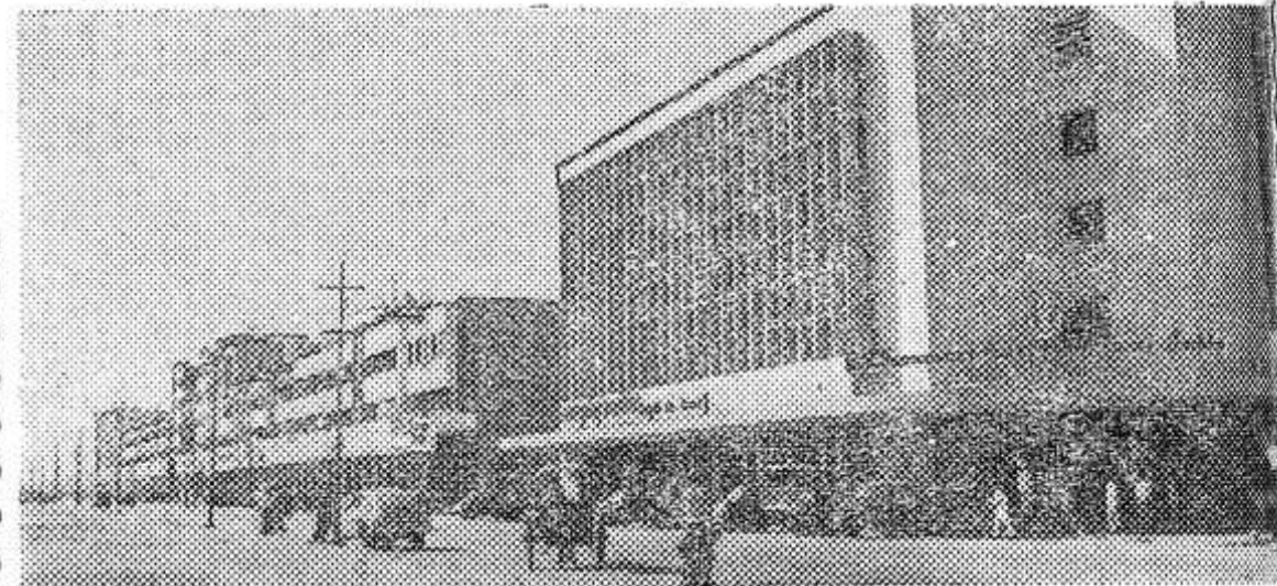
ДЕЛИ. Асаф Али роуд.