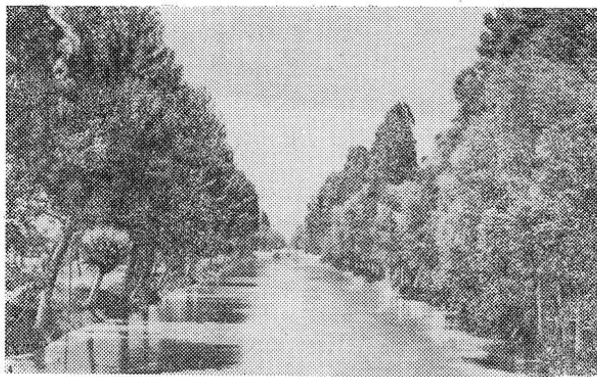
31 декабря исполняется 25 лет со дня открытия (1939 г.) Большого Ферганского канала. НА СНИМКЕ: Большой Ферганский канал.

В. Федорова, зав. Котоновским сельским клубом.