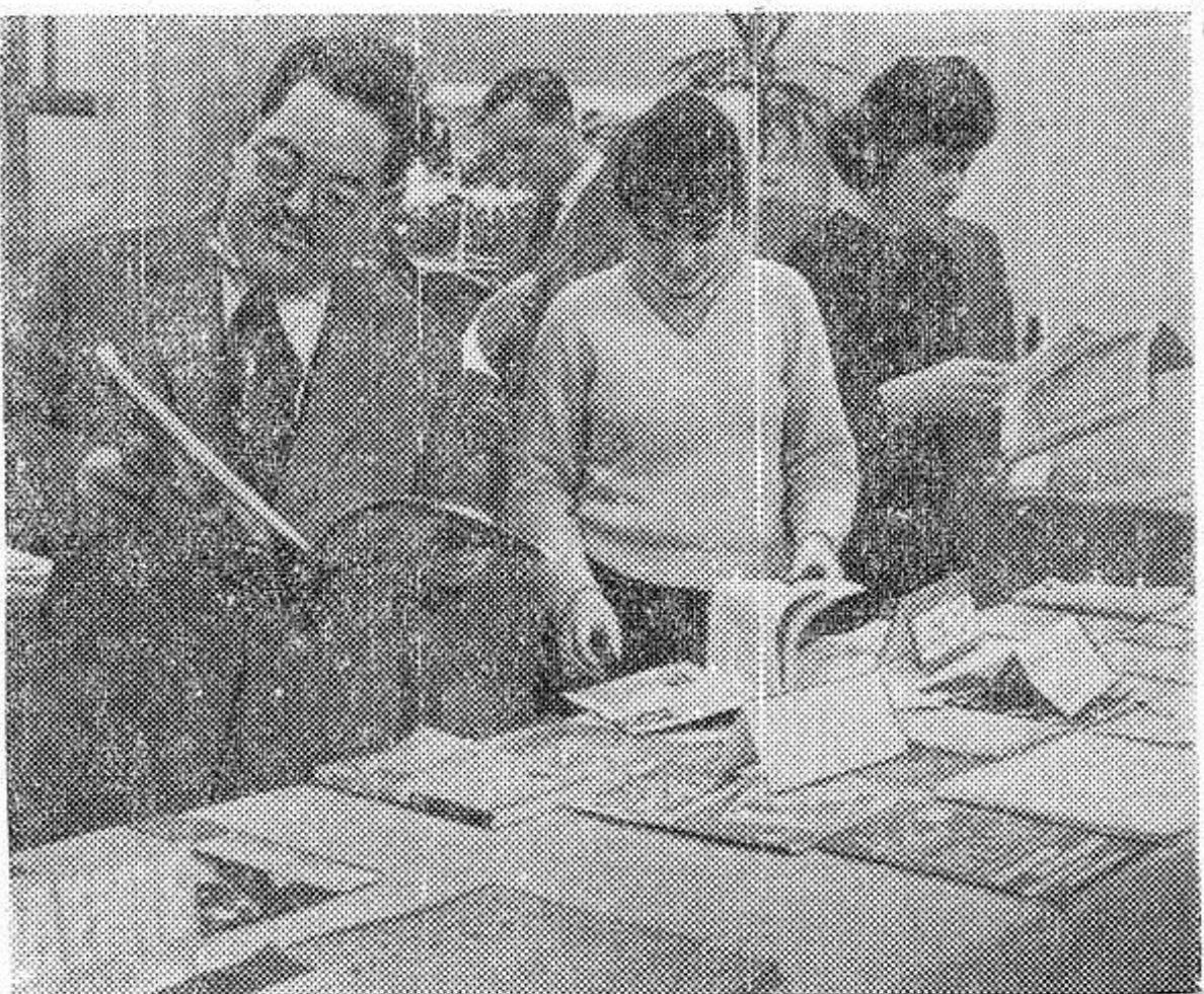
ЧЕХОСЛОВАКИЯ. В Братиславе открыта выставка советской периодической печати. С большим интересом знакомятся посетители с наиболее популяр-

ными в Советском Союзе журналами «Огонек», «Советский Союз», «Новое время», «Музыкальная жизнь» и другими.