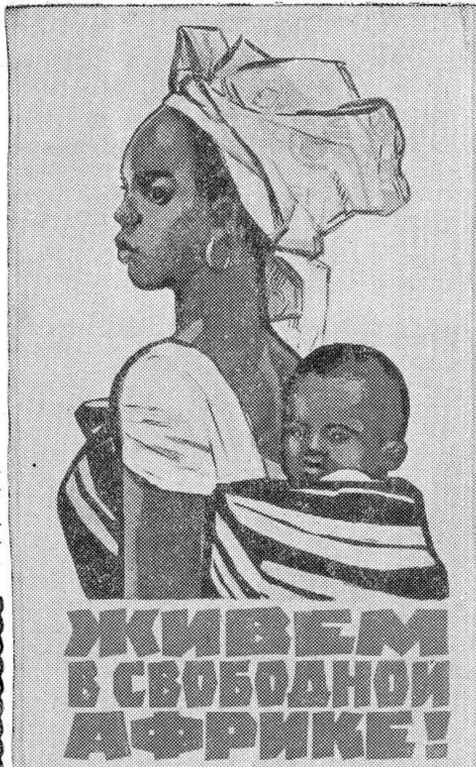
Плакаты художника Н. Ватолиной (издательство «Советский художник»).