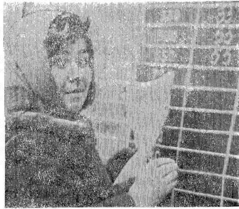
Фото и текст А. Шахманова.

Автомашина краснооктябрьцев, пройдя весовую, идет к месту разгрузки (снимок внизу). Число льняных скирд растет с каждым днем.