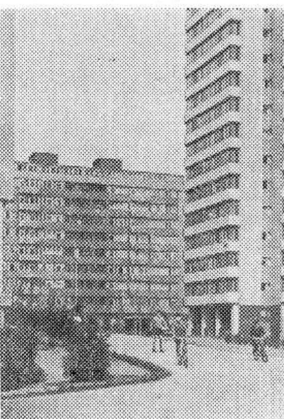
В районе наиболее широкого жилищного строительства Белграда — в «Новом Белграде».

Сегодня — национальный праздник народов Югославии