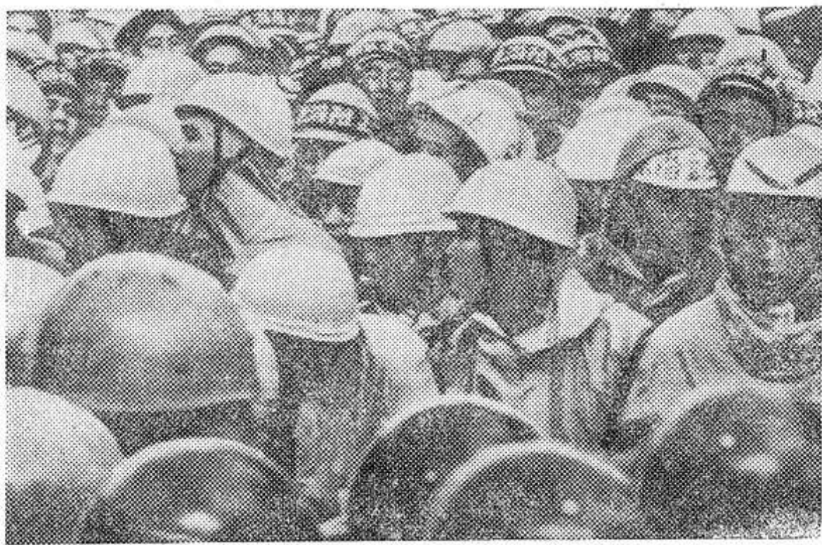
Японский народ решительно выступает против захода американских атомных подводных лодок в порты Японии. В Сасебо, куда прибыла «морской дракон» — американская атомная подводная лодка — состоялась массовая демонстрация. Между

ее участниками и отрядами полиции произошли столкновения.