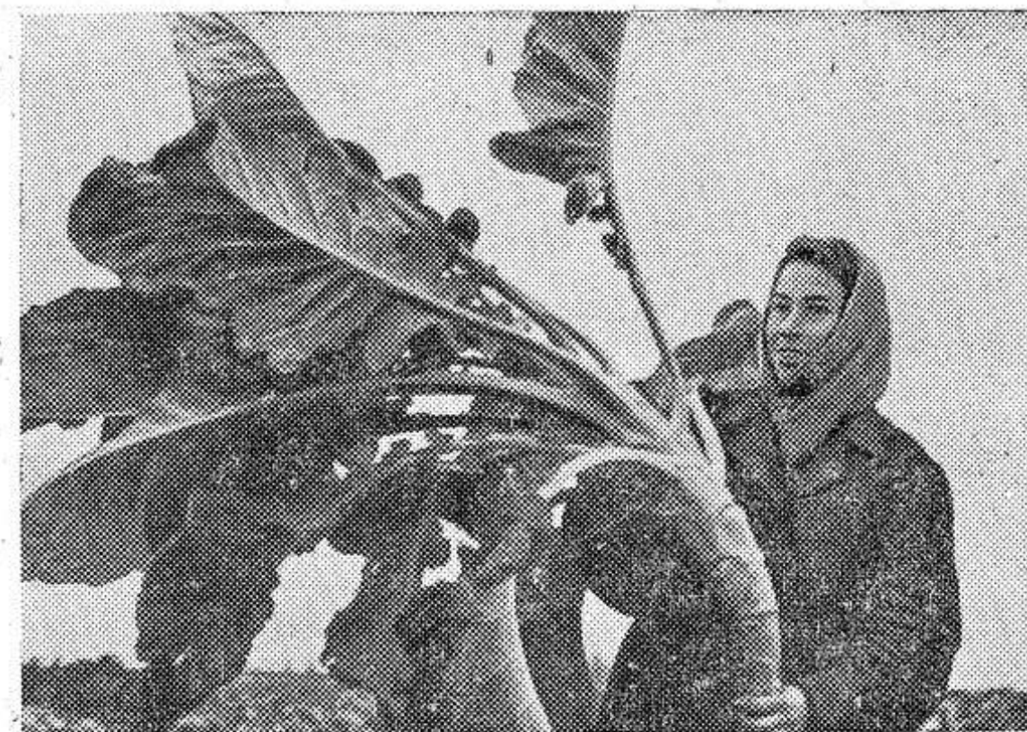
ЛЕНИНГРАДСКАЯ ОБЛАСТЬ. По 800 центнеров кормовой капусты с гектара получили полеводы совхоза «Кополь». НА СНИМКЕ: вот такую ка-