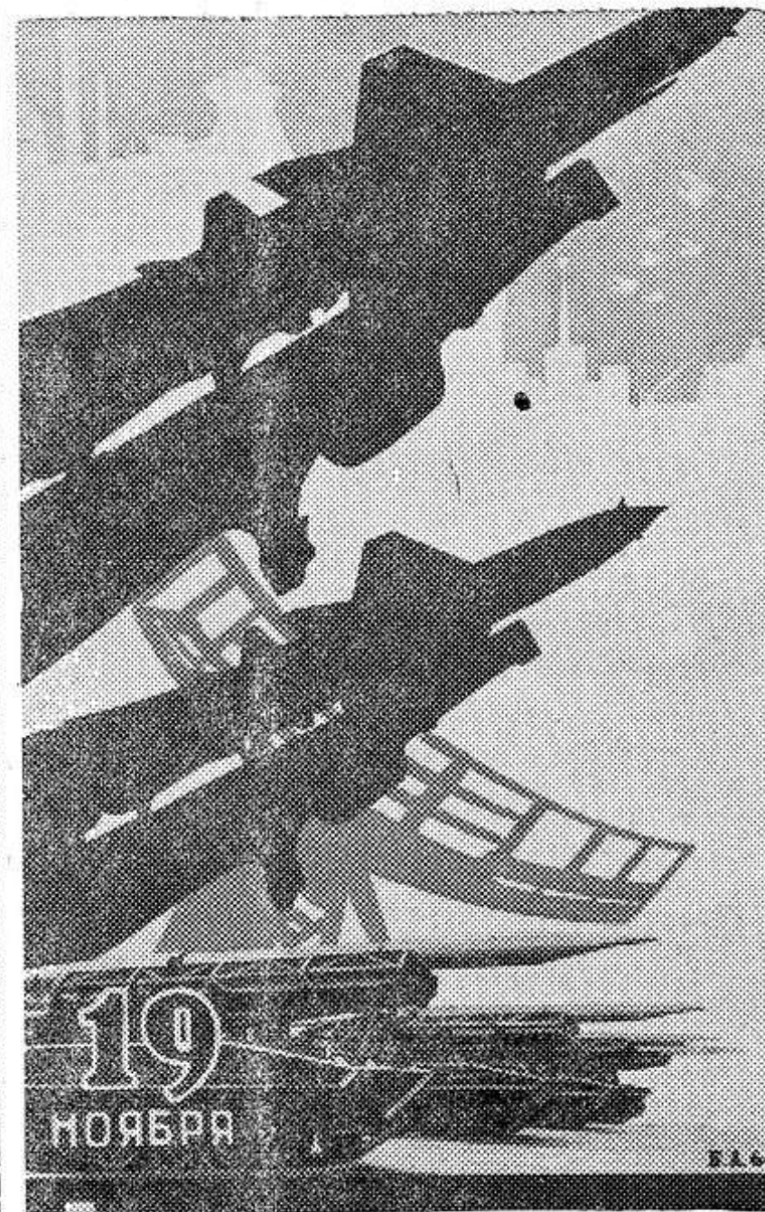
Плакат художника Б. Антонова.