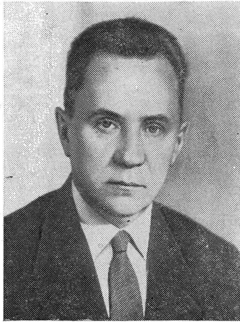
А. Н. КОСЫГИН, Председатель Совета Министров СССР