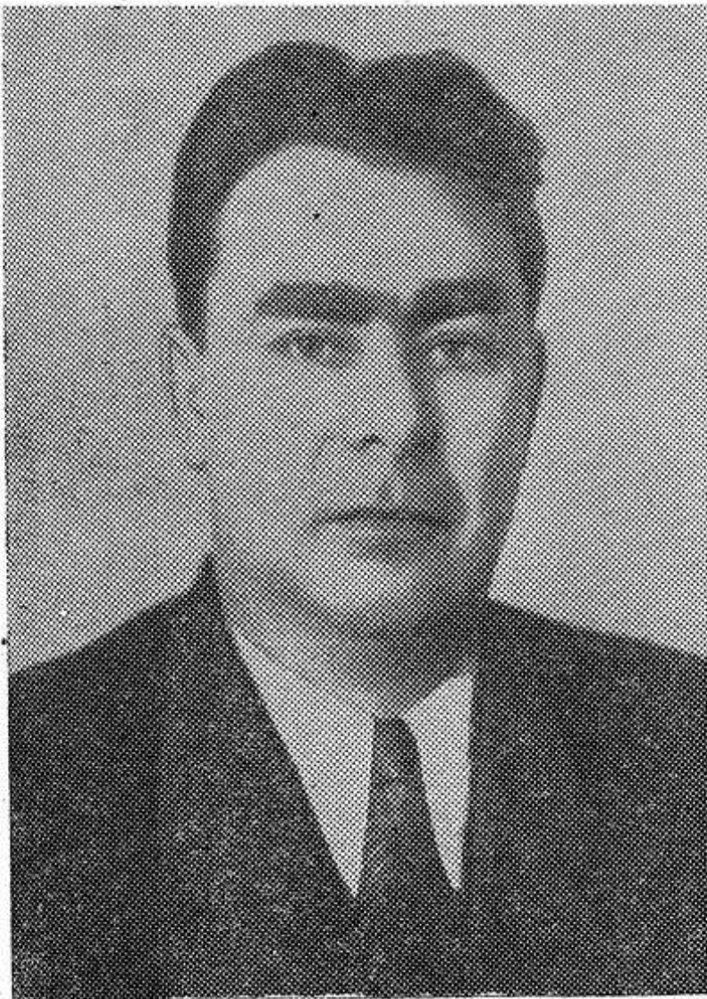
Л. И. БРЕЖНЕВ, Первый секретарь ЦК КПСС

14 октября с. г. состоялся Пленум Центрального Комитета КПСС. Пленум ЦК КПСС удовлетворил просьбу т. Хрущева Н. С. об освобождении его от обязанностей Первого секретаря ЦК КПСС, члена Президиума ЦК КПСС и Председателя Совета Министров СССР в связи с преклонным возрастом и ухудшением состояния здоровья. Пленум ЦК КПСС избрал Первым секретарем ЦК КПСС т. Брежнев Л. И.