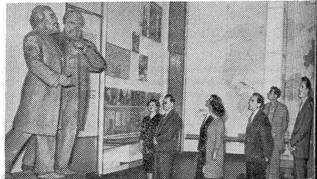
МОСКВА. В Музее К. Маркса и Ф. Энгельса состоялось торжественное открытие выставки «100 лет со дня основания Первого Интернационала».