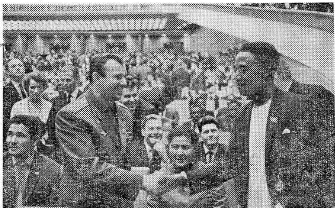
МОСКВА. В Кремлевском Дворце съездов.