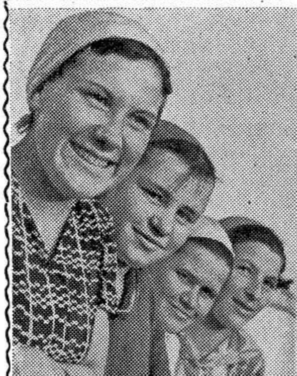
Комсомольско-молодежная ферма колхоза имени Калинина Вытегорского производственного управления—одна из лучших в Вологодской области. За пастбищный период нынешнего года доярки фермы получили по 1.050 килограммов молока от каждой коровы. Бригада удостоена звания коммунистической, ей вручен переходящий вымпел обкома комсомола.