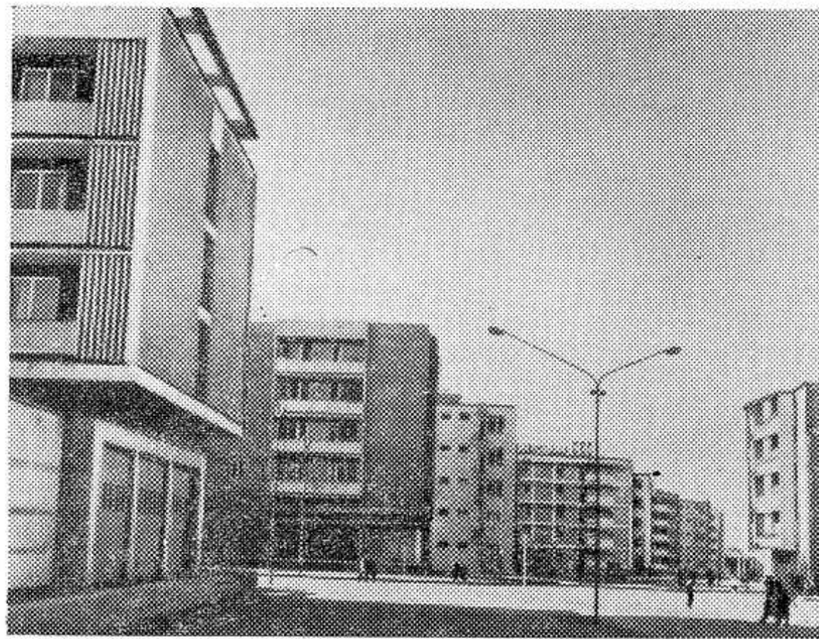
Около 23 процентов населения Румынской Народной Республики получили новые квартиры за последние 13 лет. В текущем году предусмотрено построить еще 54 тысячи квартир. НА СНИМКЕ: новые дома в центре города Бая-Маре.

Так с помощью науки болгарские крестьяне строят новую жизнь, создают народное богатство. Трудники врабевского кооператива превратили огражденные горами поле в уголок плодородия.