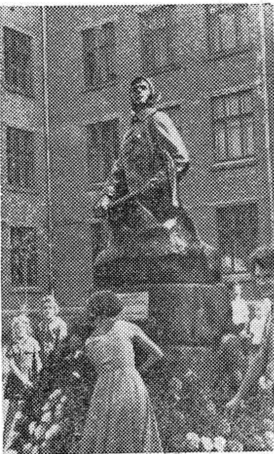
УКРАИНСКАЯ ССР. В городе Хмельницком на площади у здания средней школы № 17 открыт памятник Николаю Островскому. Автор монумента — местный скульптор комсомолец Владимир Корнев. Это его подарок городу ко дню 60-летия писателя.