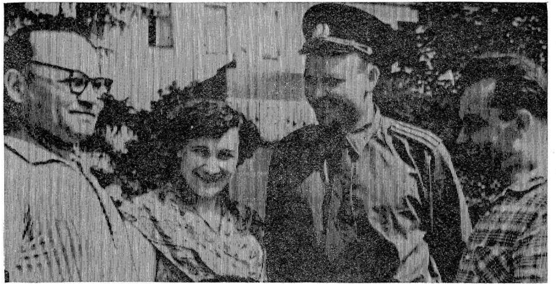
На праздник 20-летия освобождения Опочки и района от немецко-фашистских захватчиков приехали из разных мест страны участники партизанского движения, бойцы и командиры частей Советской Армии, принимавшие участие в освобождении города и населенных пунктов района. Наш фотокорреспондент запечатлел на пленке, когда на Совет-