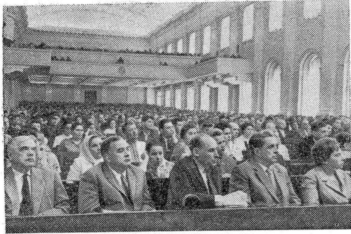
МОСКВА. Четвертая сессия Верховного Совета СССР шестого созыва. НА СНИМКЕ: во время заседания.

— От всей души благодарю партию и правительство за неустанную заботу о нас, стоящих на страже здоровья трудящихся. Я уже почти четверть века проработала в больнице. Мой труд материально обеспечен. Сейчас я получаю около семидесяти двух рублей, а буду получать не менее восьмидесяти пяти. Значительно увеличиваются заработки и у других сотрудников нашего отделения.