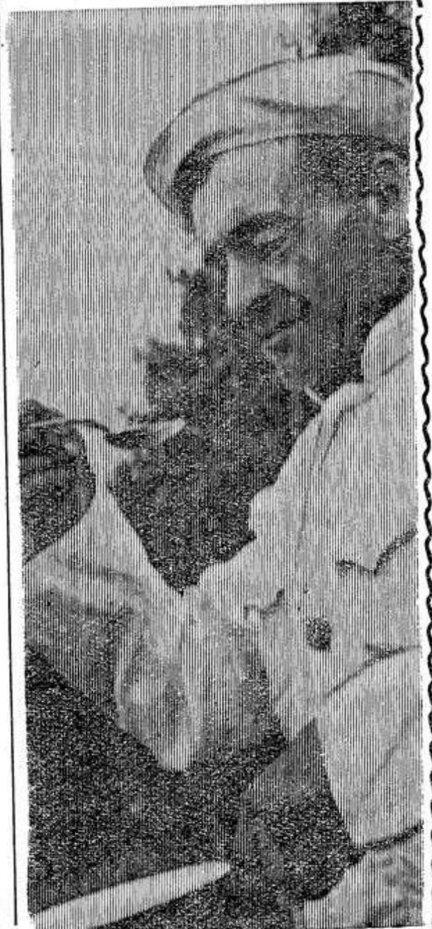
Фото и текст А. Шахманова.