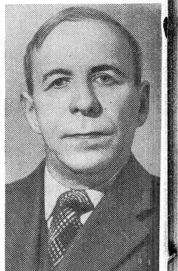
10 июля исполняется 75 лет со дня рождения Н. Н. Асеева (1889), известного советского поэта.

НА СНИМКЕ: Н. Н. Асеев.