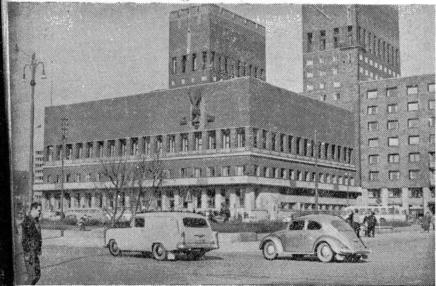
Столица Норвегии Осло. Городская ратуша.

Время не ждет. Уборка урожая не за горами. Долг хлеборобов, механизаторов, всех тружеников села встретить ее во всеоружии, умело провести ее.