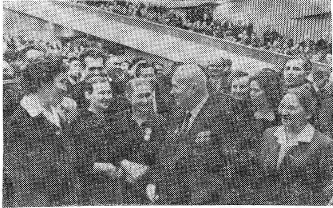
Н. С. Хрущев среди делегатов XXII съезда КПСС.