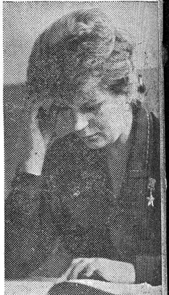
МОСКВА. Отряд советских космонавтов живет своей трудовой жизнью, готовится к новым космическим полетам. Советские космонавты изучают и обрабатывают накопленный материал, непрерывно совершенствуют свои теоретические и практические знания, занимаются в Академии имени Жуковского. НА СНИМКЕ: Валентина Николаева-Терешкова на занятиях.