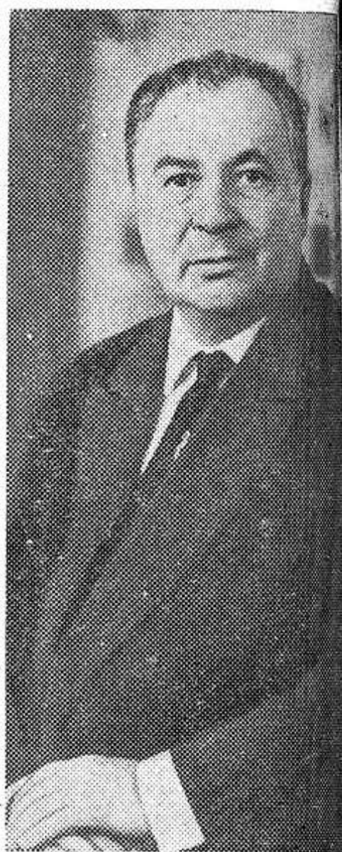
МОСКВА. 13 апреля исполнилось 60 лет со дня рождения известного советского поэта Александра Алексеевича Жарова. Старейший комсомолец, он был участником знаменитого 3-го съезда РКСМ, на котором выступал В. И. Ленин. Перу А. А. Жарова принадлежит прошедшая сорокалетнее испытание временем пионерская песня «Взвейтесь кострами синие ночи, им написаны такие популярные песни, как «Заветный камень», «Грустные ивы», «Песня бывших походов», «Песня «Мы — за мир!», сочиненная в содружестве с композитором С. И. Туликовым звучит на всех языках земного шара. Широко известны поэмы Жарова «Гармонь», «Варя Одицова», «Керим» и поэма о героях Великой Отечественной войны.

Итоги учебного года в системе политического просвещения надо будет обсудить на собраниях в первичных партийных и комсомольских организациях и начать подготовку к занятиям на 1964—65 учебный год.