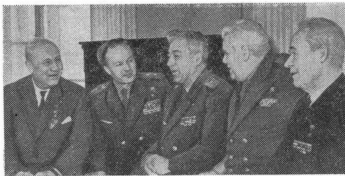
На снимке: первые Герои Советского Союза летчики полярной авиации (слева направо): М. Т. Слепнев, Н. П. Каманин, А. В. Ляпидевский, М. В. Водопьянов и В. С. Молоков, принимавшие участие в спасении челюскинцев.

Челюскинская эпопея показала всему миру величие советских людей, вошла яркой страницей в летопись покорения Арктики.