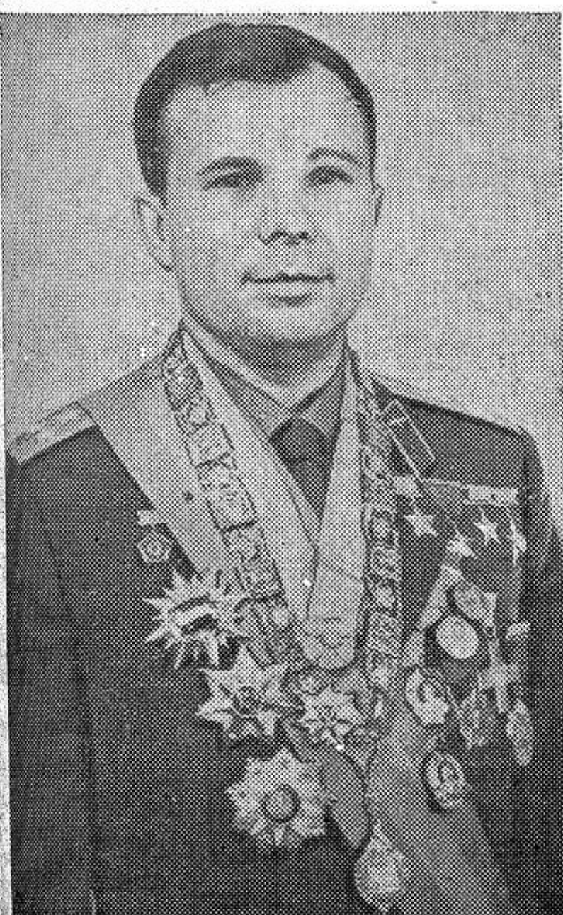
Первый в мире космонавт Юрий Гагарин.

С советской стороны заявление подписал Первый секретарь ЦК Коммунистической партии Советского Союза, Председатель Совета Министров СССР Н. С. Хрущев, с венгерской стороны — Первый секретарь ЦК Венгерской социалистической рабочей партии, Председатель Венгерского Революционного рабоче-крестьянского правительства Янош Кадар.