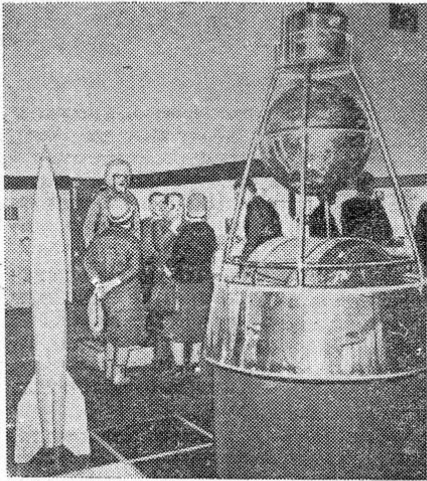
В Варшаве открыта польско-советская выставка «От Коперника до искусственной планеты». Ее экспонаты рассказывают об огромном прогрессе человеческой мысли и науки, о космосе, о достижениях в области ракетной техники, космических и географических исследованиях, а также о подготовке и осуществлении полетов человека в космос. НА СНИМКЕ (слева): в одном из залов варшавского Дворца культуры и науки, где открыта выставка.