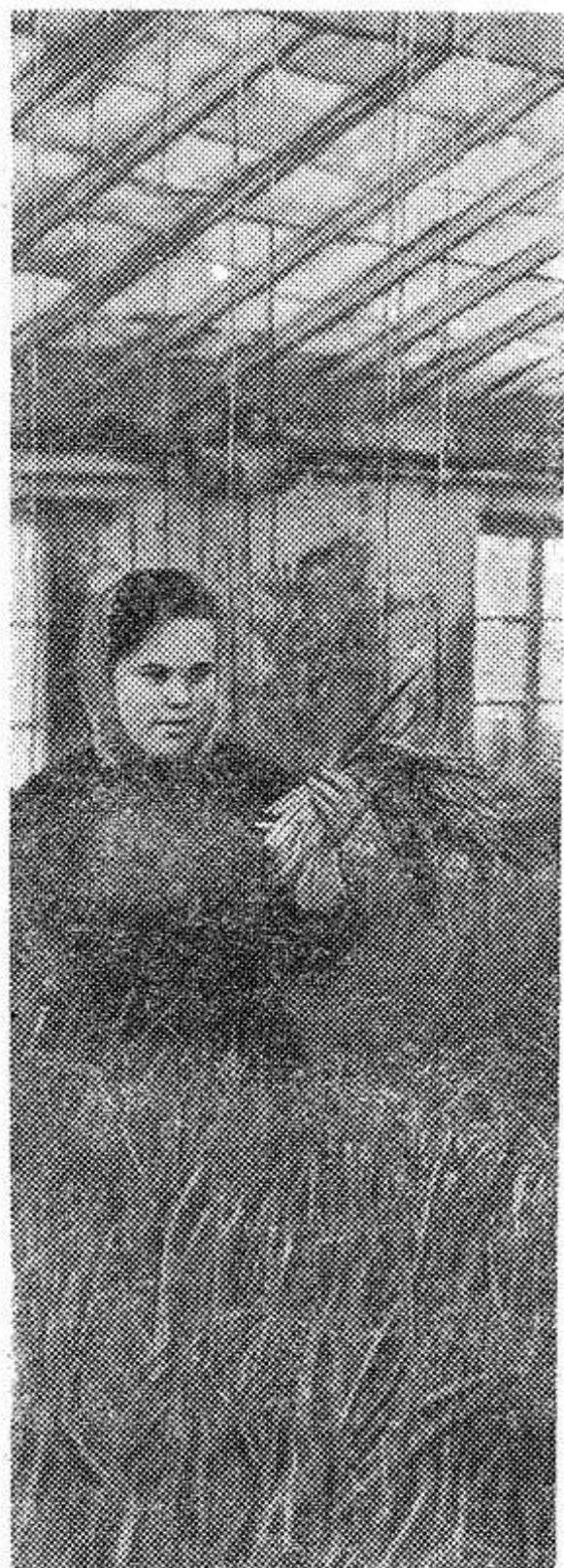
КОМИ АССР. Круглый год снабжает горожан свежими овощами, зеленым луком тепличное хозяйство комбината «Воркутауголь». В этом году коллектив дал слово вырастить 3.150 центнера овощей — на 133 центнера больше, чем в минувшем году.

НА СНИМКЕ: в тепличном хозяйстве комбината.