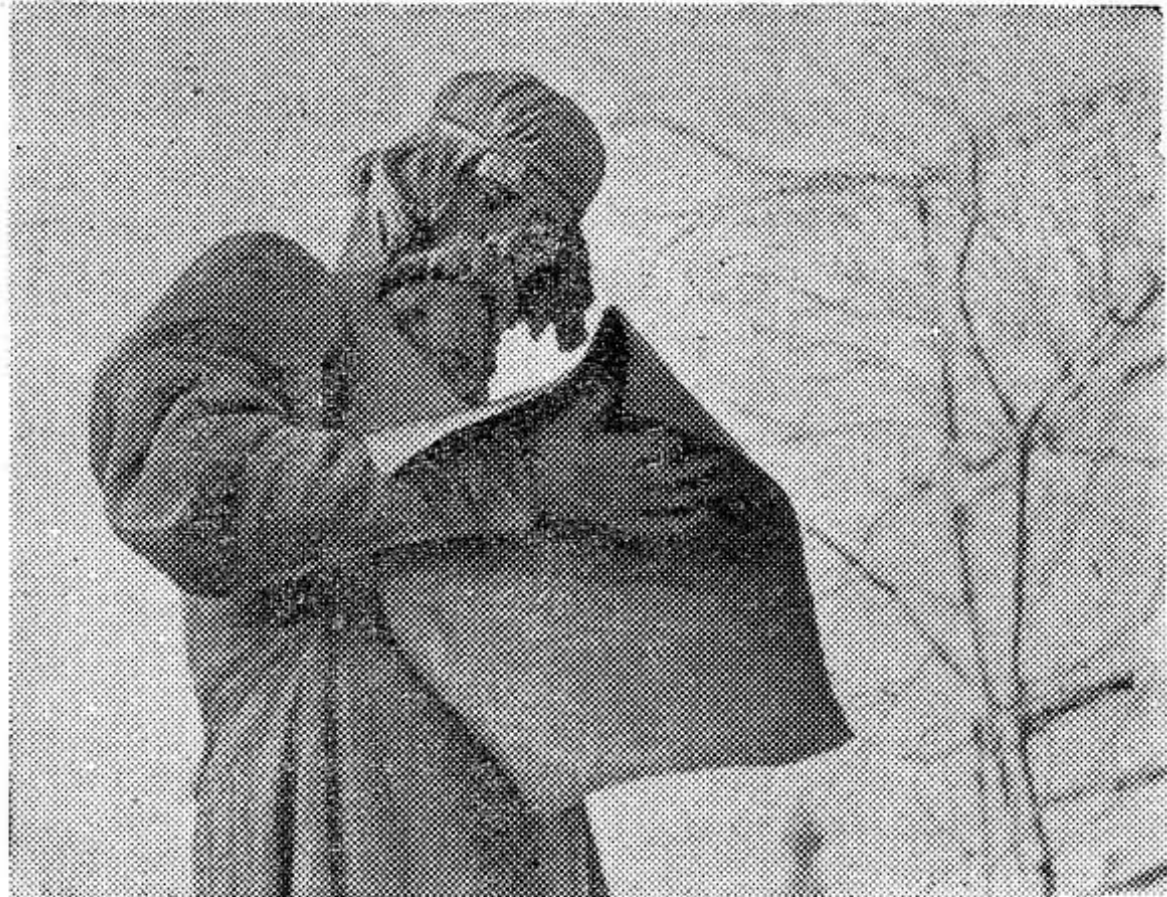
Москва. Памятник первопечатнику Ивану Федорову.