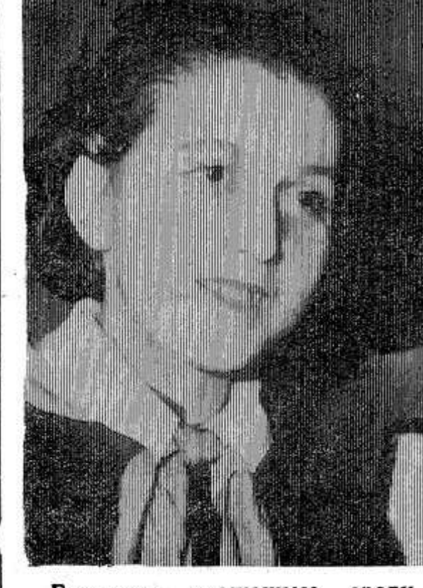
Большим уважением среди ребят Глубоковской одиннадцатилетней школы пользуется кружок художественной самодеятельности. Его участники выступают не только в школе, а частые гости в отдаленных бригадах совхоза «Глубоковский».