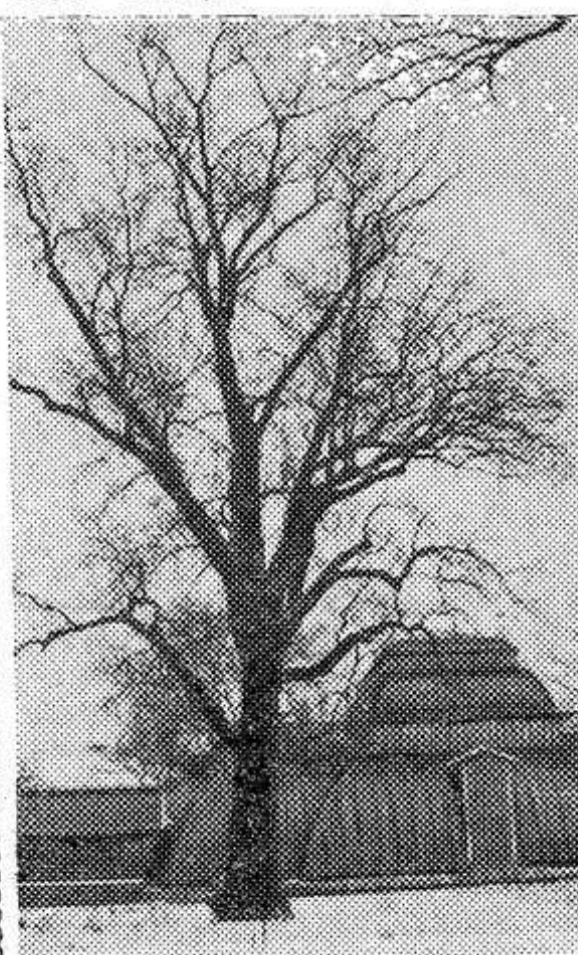
НА СНИМКЕ: осокорь — дерево, растущее в парке Ботанического института со времен Петра I.

ЛЕНИНГРАД. В феврале исполняется 250 лет со дня создания по указу Петра I Аптекарского огорода в Петербурге. Первоначально здесь выращивались лекарственные растения,