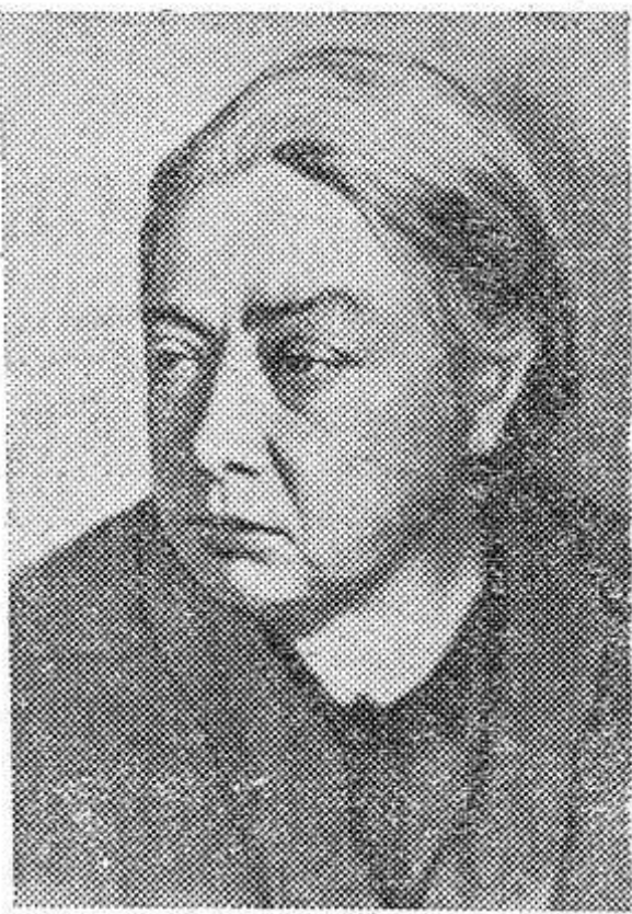
КРУПСКАЯ НАДЕЖДА КОНСТАНТИНОВНА.

Сегодня исполняется 95 лет со дня рождения (1869 г.) Н. К. Крупской, видной деятельницы Коммунистической партии, жены, друга и помощника В. И. Ленина.