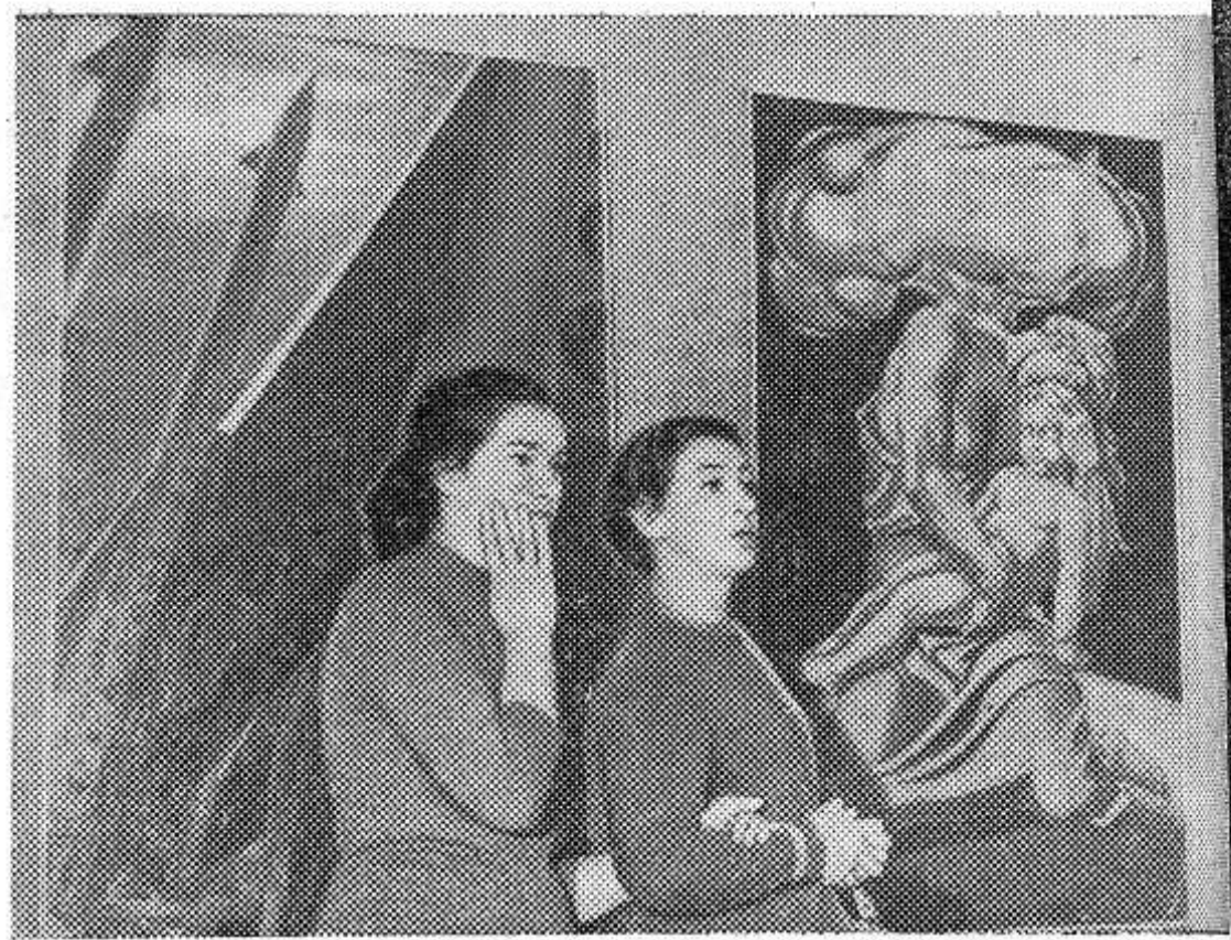
МОСКВА. В залах Академии художеств СССР открыта выставка произведений изобразительного искусства, выдвинутых на соискание Ленинской премии. НА СНИМКЕ: посетители ос-

ОТ РЕДАКЦИИ. Редакция газеты «Красный маяк» обращается к секретарям партийных и комсомольских организаций, к лекторам, пропагандистам, учителям с просьбой поделиться опытом работы. Пишите к нам о том, как в вашем колхозе, совхозе, клубе, школе ведется научно-атеистическая пропаганда.