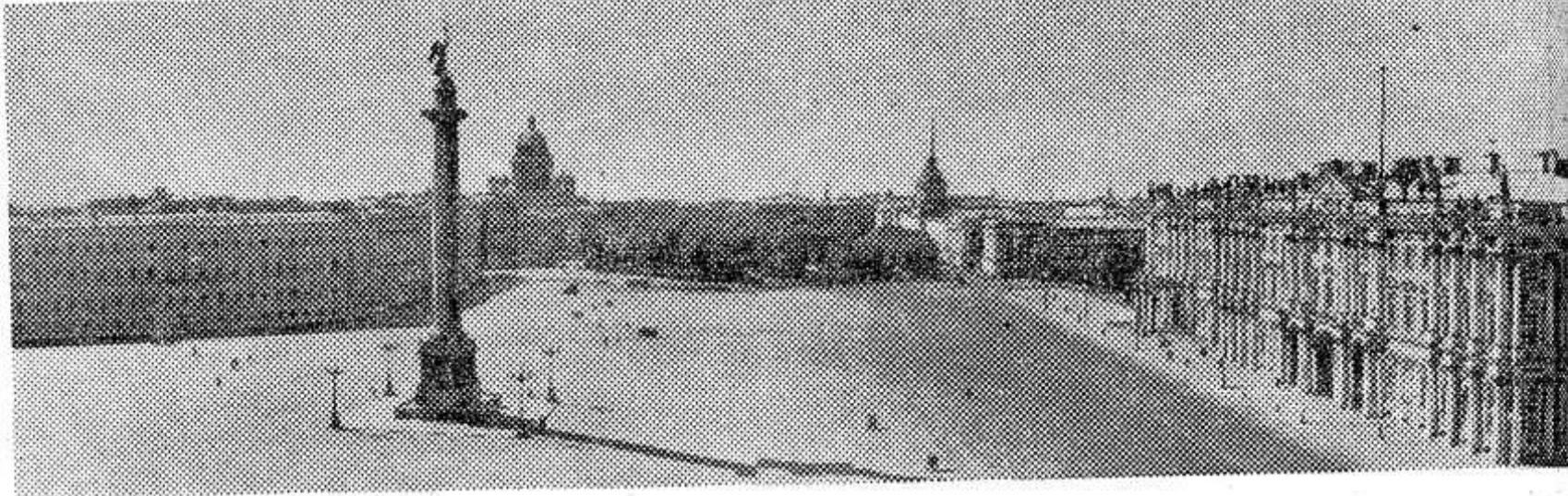
Ленинград. Дворцовая площадь.

В ноябре 1941 года от алиментарной дистрофии в городе погибло 11.085 человек, в декабре — 52.881. В Музее истории Ленинграда собрано много потрясающих человеческих документов тех суровых дней. Среди них — фотография девочки Тани Савичевой и ее записная книжка. Невозможно без дрожи читать ее записи: