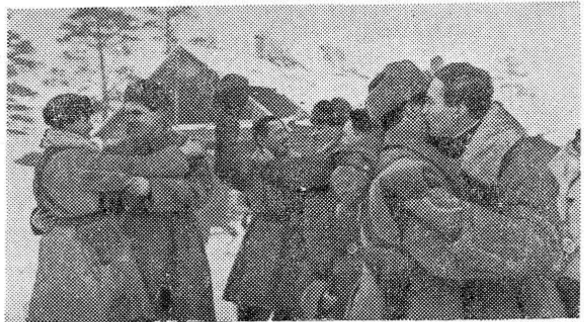
Блокада Ленинграда прорвана! НА СНИМКЕ: встреча бойцов и командиров Волховского и Ленинградского фронтов.

Дело будет слушаться в суде Петровского района г. Д. нечка.