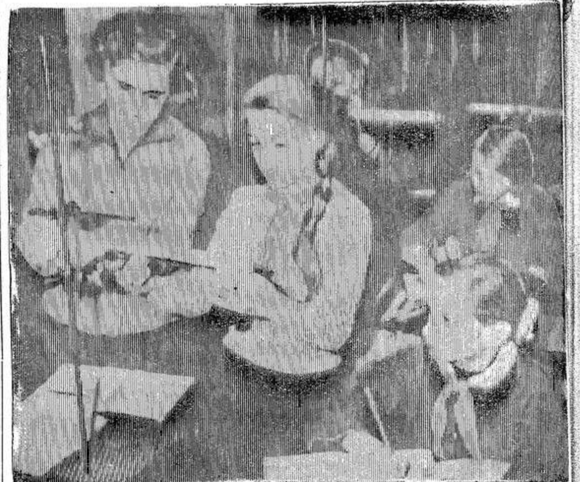
Кто знает, какую специальность выберут себе в будущем ребята из Звонской восьмилетней школы. А пока они настойчиво овладевают знаниями. НА СНИМКЕ: ученицы седь-

«КРАСНЫЙ МАЯК» 2 стр. 15 января 1964 года.