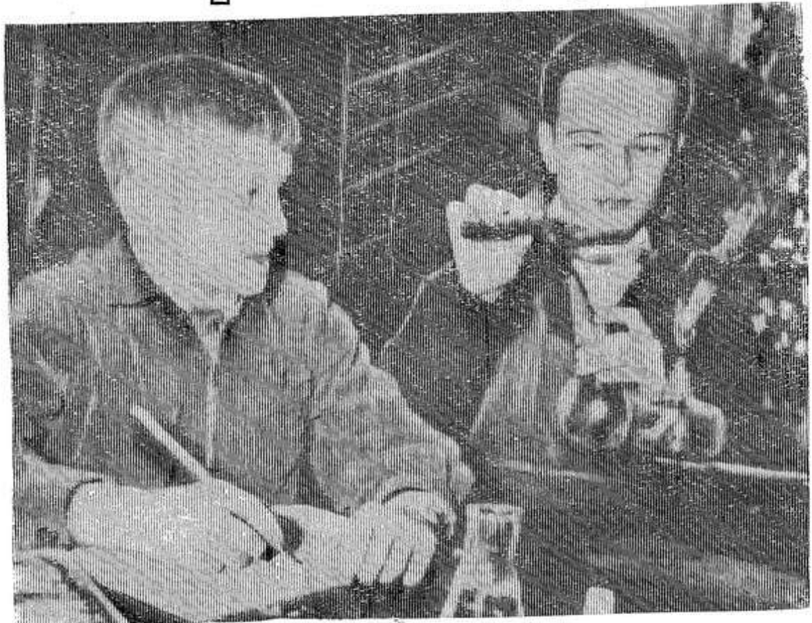
Глубокие и прочные знания получают ученики Звонской восьмилетней школы. Вместе с теоретическими навыками в школе

Такое количество зерна позволит в достатке обеспечить продовольствием население, выделить семь с половиной миллиардов пудов зерна на нужды животноводства. Хлеб, как говорят, — голова всему. Будет зерно — будет и мясо, и молоко, и другие продукты. В 1970 году колхозы и совхозы должны произвести 20 — 25 миллионов тонн мяса, 115 — 135 миллионов тонн молока, 68 миллиардов яиц.