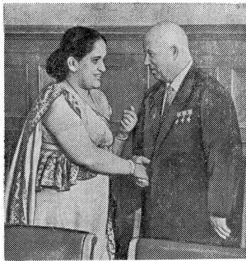
★ Москва. В Кремле состоялась беседа между Председателем Совета Министров СССР Н. С. Хрущевым и Премьер-министром, министром обороны и иностранных дел Цейлона С. Бандарананке.