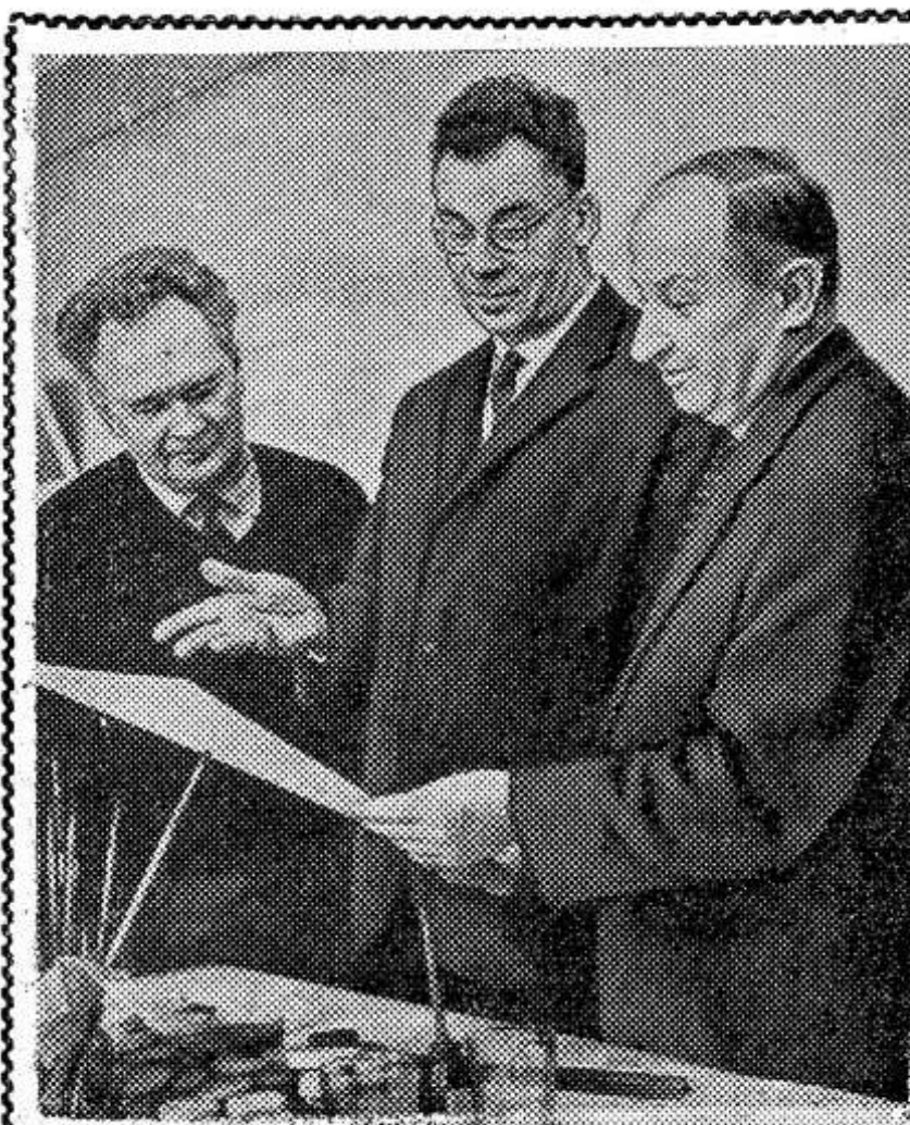
Москва. Кто не знает имя Кукрыникова — коллективного псевдонима замечательных советских художников Михаила Куприянова, Николая Соколова и Порфирия Крылова? Их карикатуры, картины, иллюстрации известны во всем мире. На днях самому младшему из них — Михаилу Васильевичу Куприянову исполняется 60 лет.

На снимке (слева направо): Н. Соколов, М. Куприянов и П. Крылов.