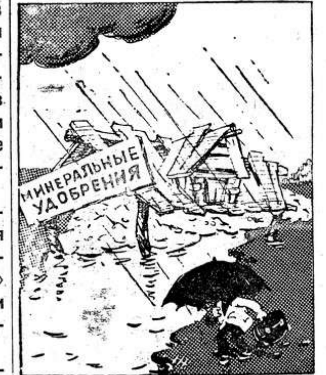
...Минеральные воды. Рис. Ю. Андреева.