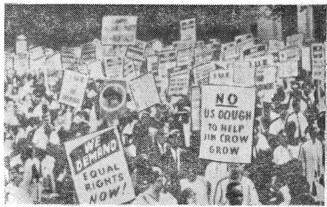
Столица Соединенных Штатов Америки Вашингтон. Массовый поход негров США под лозунгом «Работы и свободы».