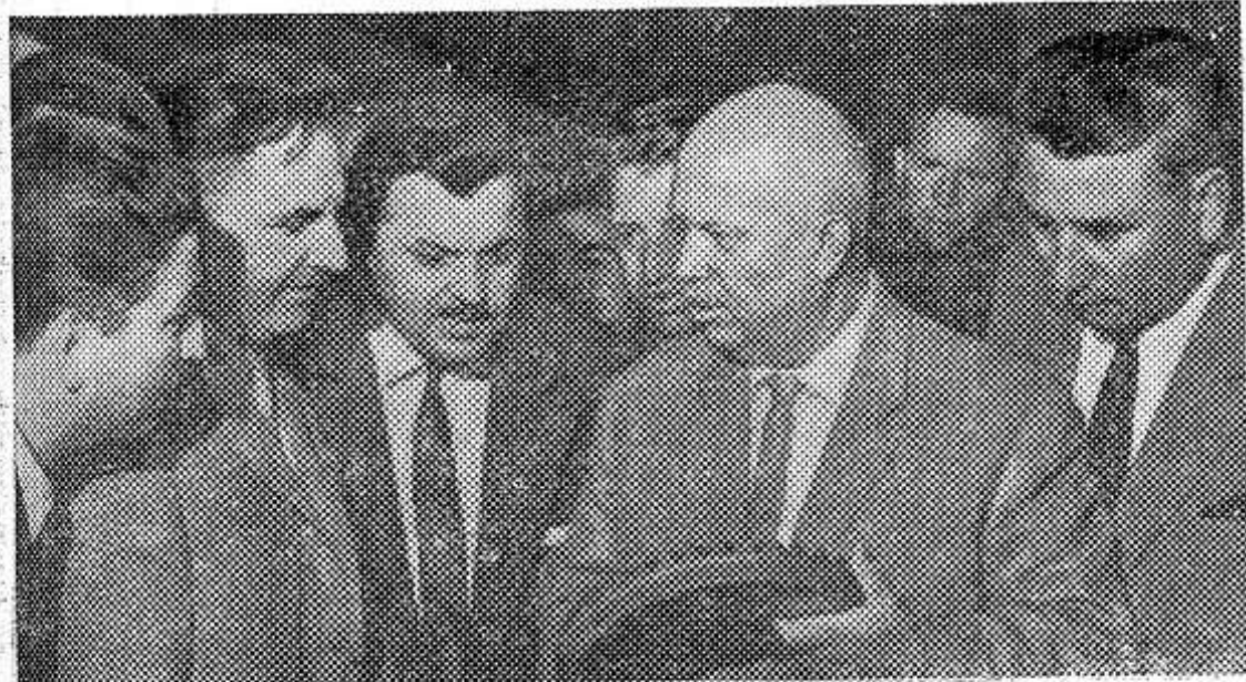
Первый секретарь ЦК КПСС, Председатель Совета Министров СССР Н. С. Хрущев в Югославии. НА СНИМКЕ: Н. С. Хрущев

в одном из цехов комбината моторо- и тракторостроения в Раковнице — пригороде Белграда.