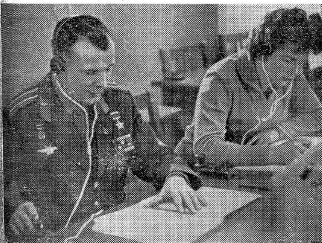
Первая в мире женщина-космонавт Валентина Владимировна Терешкова и первый в мире летчик-космонавт Юрий Алексеевич Гагарин.