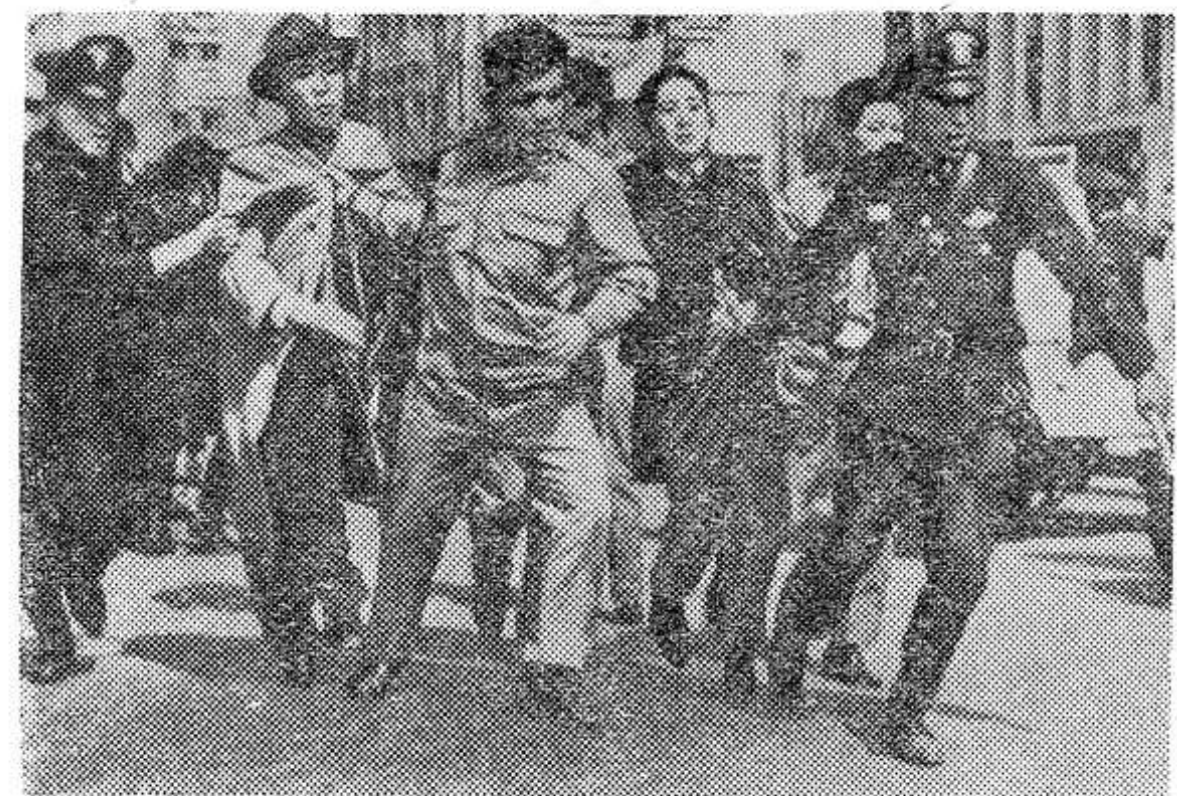
В Сеуле состоялась демонстрация протеста, вызванная заявлением главаря южнокорейской военной клики генерала Пак Чжон Хи о том, что военный режим в

8 и 9 июня ожидается прохладная погода со слабыми заморозками.