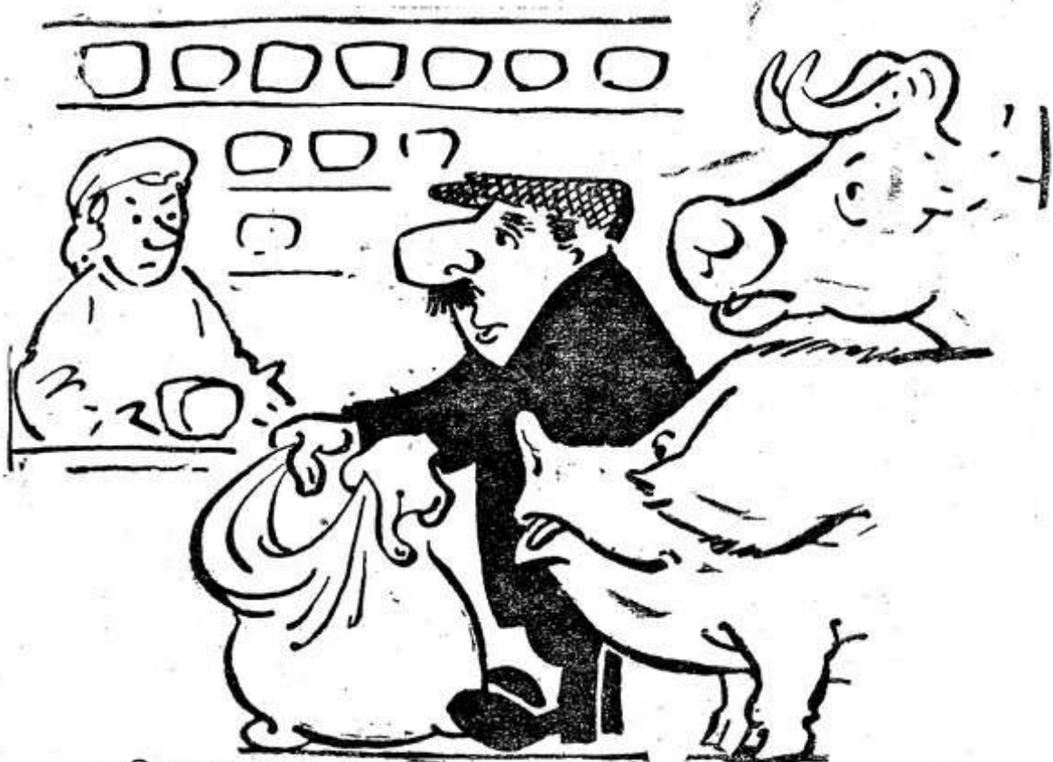
—Отпустите хлеба на троих! Рис. В. Волкова.

Имеются факты, когда некоторые недобросовестные люди кормят принадлежащий им скот хлебом, нанося этим большой ущерб государству.