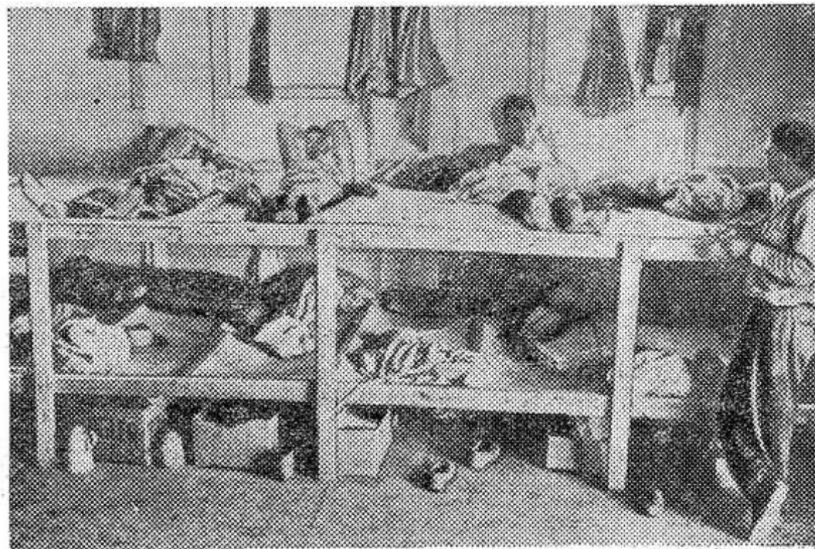
Адрес и телефоны редакции: Псковская область, г. Опочка Дом Советов (2-й этаж)

По-прежнему во всей стране продолжается широкая кампания солидарности населения с бастующими шахтерами. Повсюду проходит сбор финансовых средств в фонд бастующих.